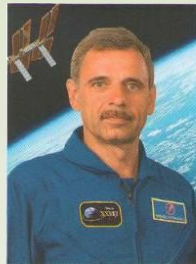
Алексей Губарев Олег Атьков Сергей Авдеев Михаил Корниенко