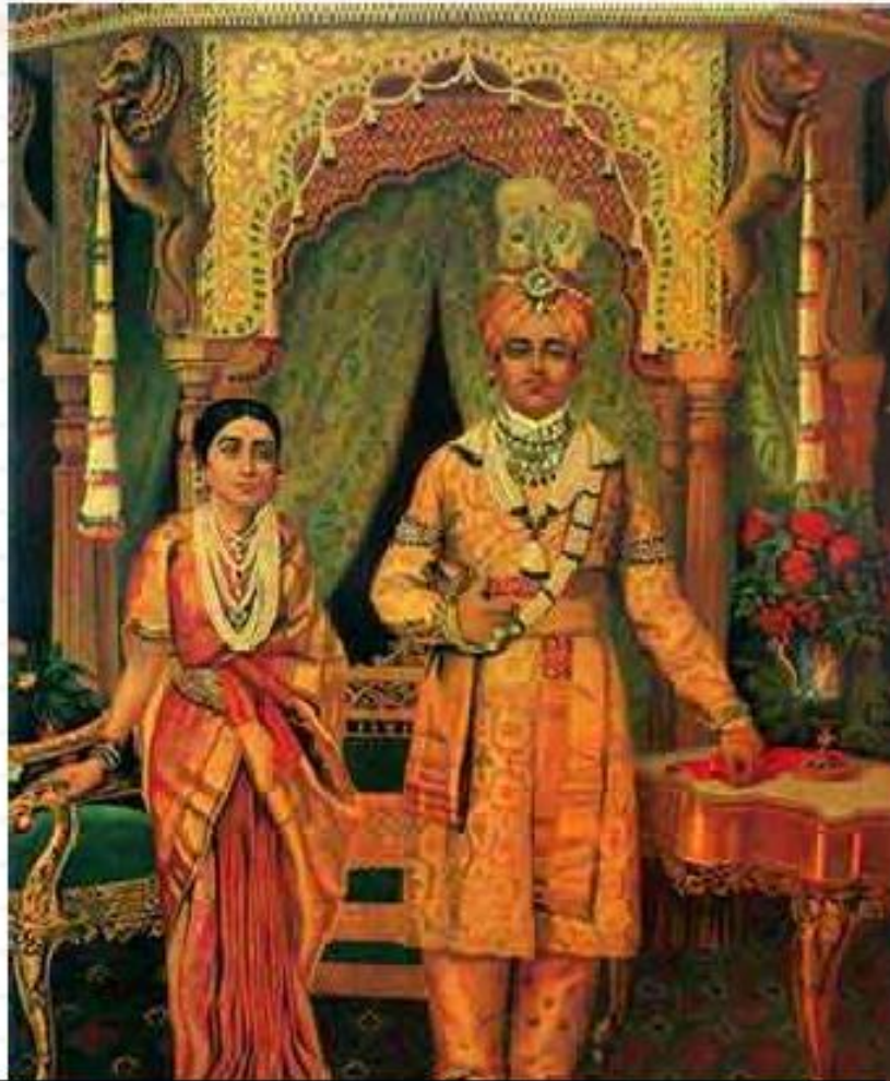
Раджа с супругой

В VI—VII веках в Индии образовалось до 70 самостоятельных княжеств. Князья—раджи —жили в роскошных дворцах вместе со своими придворными, воинами и высшими чиновниками, разъезжали на специально обученных, в богатом убранстве слонах, которых держали и в своем войске