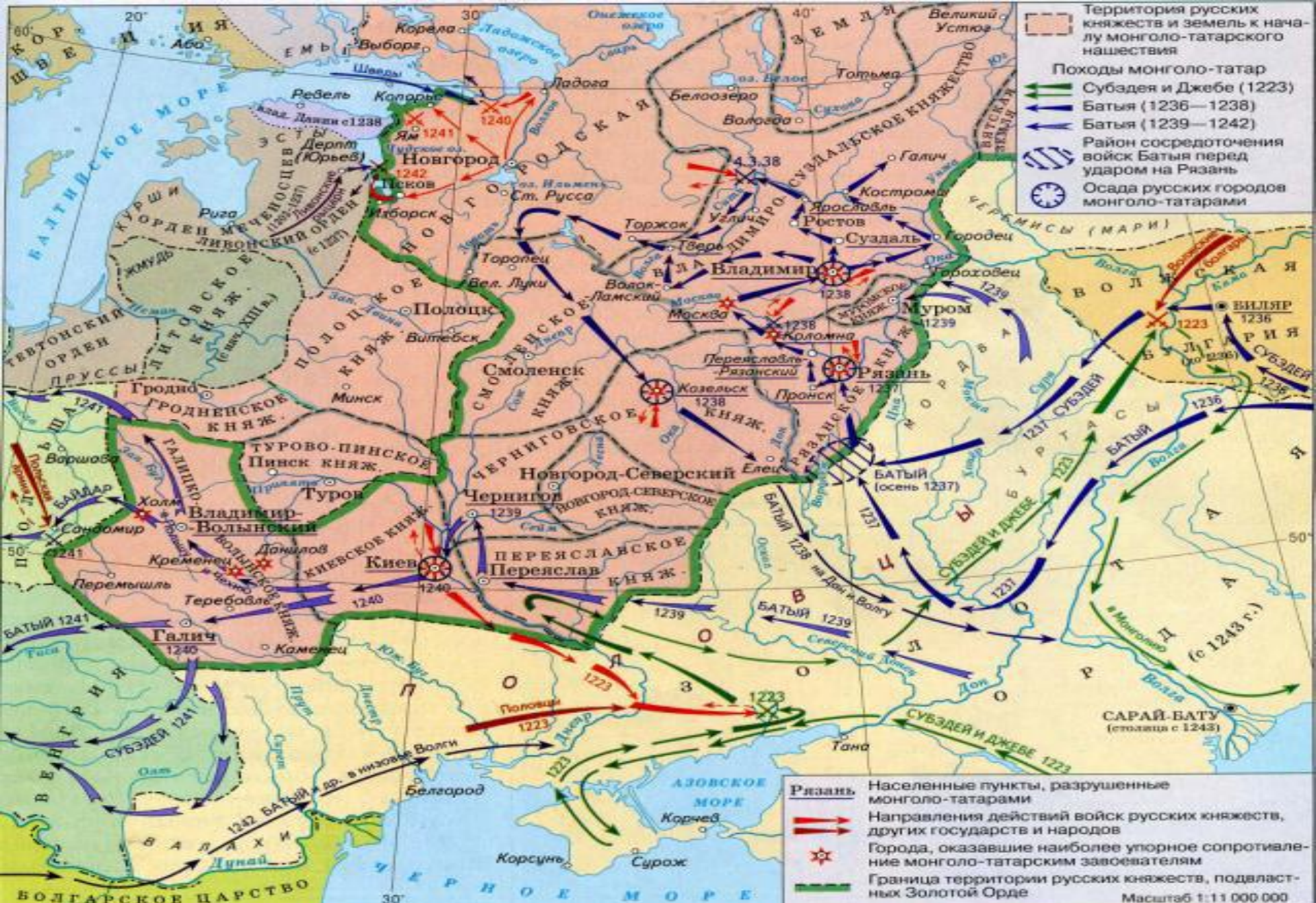
Путь в Орду митрополита Алексея проходил по Поволжью