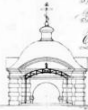
Вид с юга

Великий Император Николай Павлович Императрица Александра Фёдоровна Великий Князь Николай Александрович