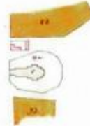
Вид с юга