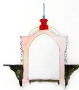
Вид с юга Восточный Вокзал