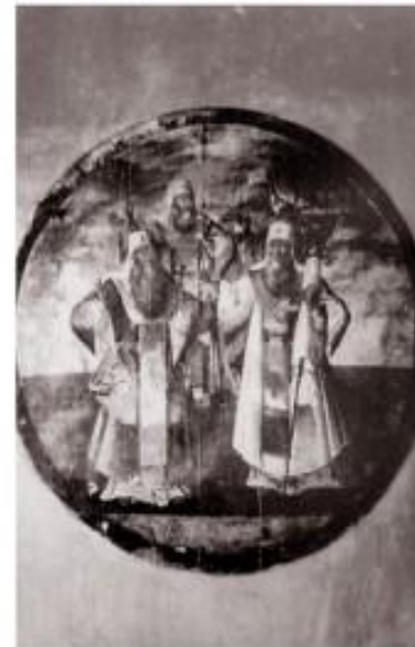
Древний крест, стоявший на месте часовни до 1801 г., текст надписи и росписи в интерьере часовни. Фото 1903 г.