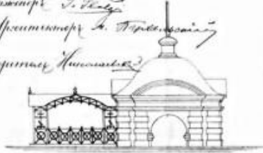
Вид с юга