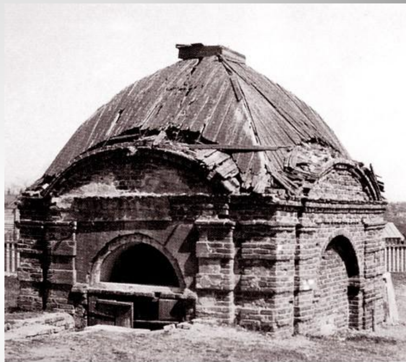
Здание Вознесенской часовни перед ремонтom в начале XX в. Фото 1903 г.