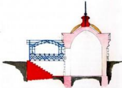
Вид с юга Восточный Вокзал