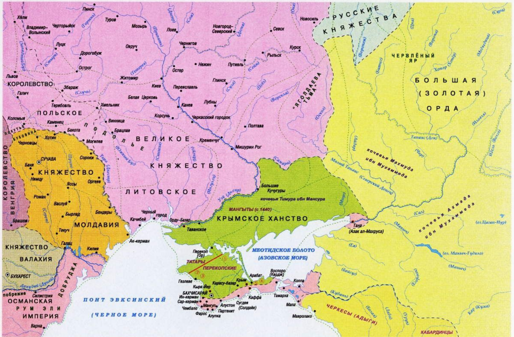
Автор карты А.А. Астайкин