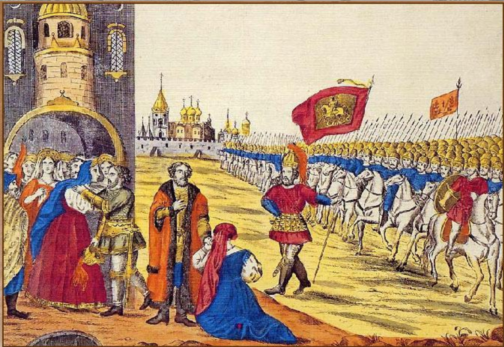
Гражданин Минин и князь Пожарский