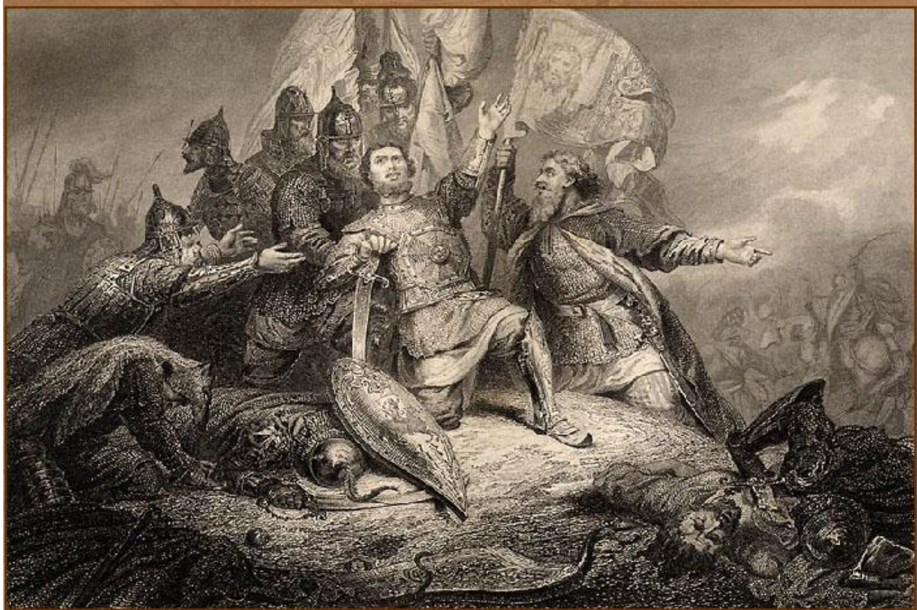
Пожарский в битве под Москвой