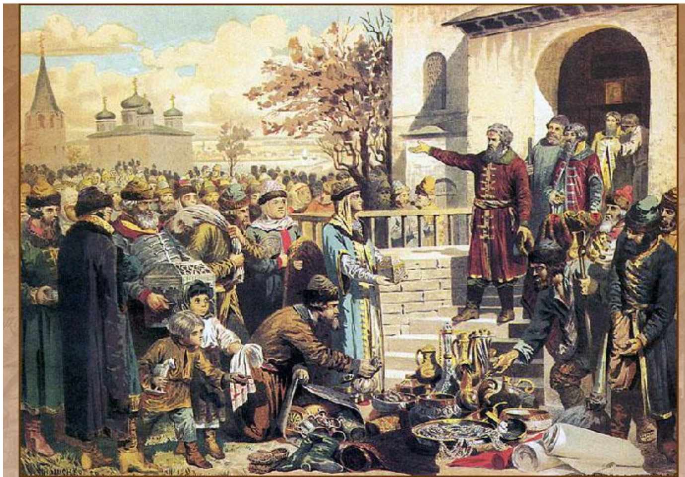
Воззвание Козьмы Минина к нижегородцам

Осенью 1611 г. по призыву нижегородского купеческого старосты К. Минина началось формирование народного ополчения.