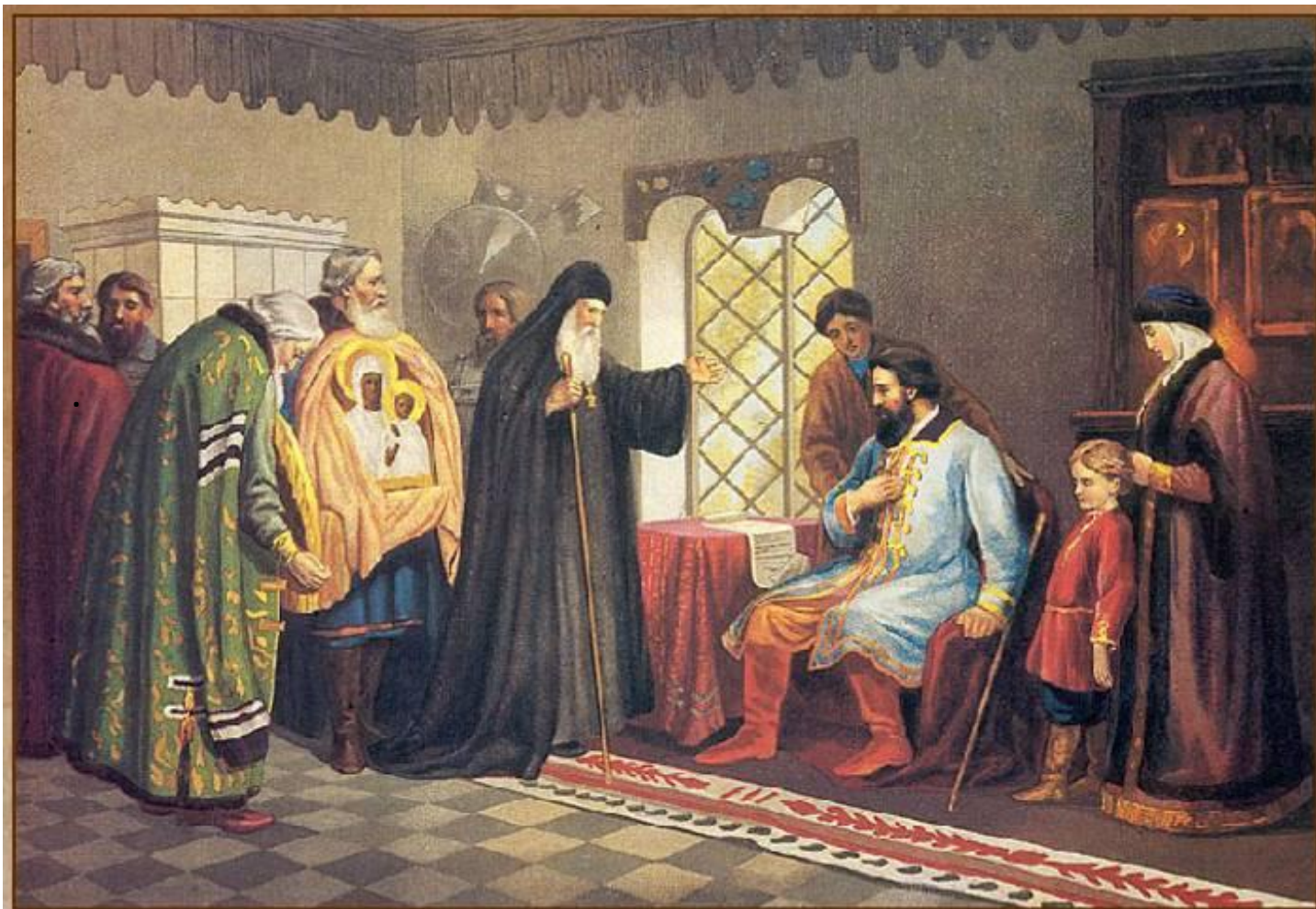
Нижегородские послы у князя Дмитрия Пожарского. 1611 г.

Военным руководителем ополчения стал князь Д. М. Пожарский.