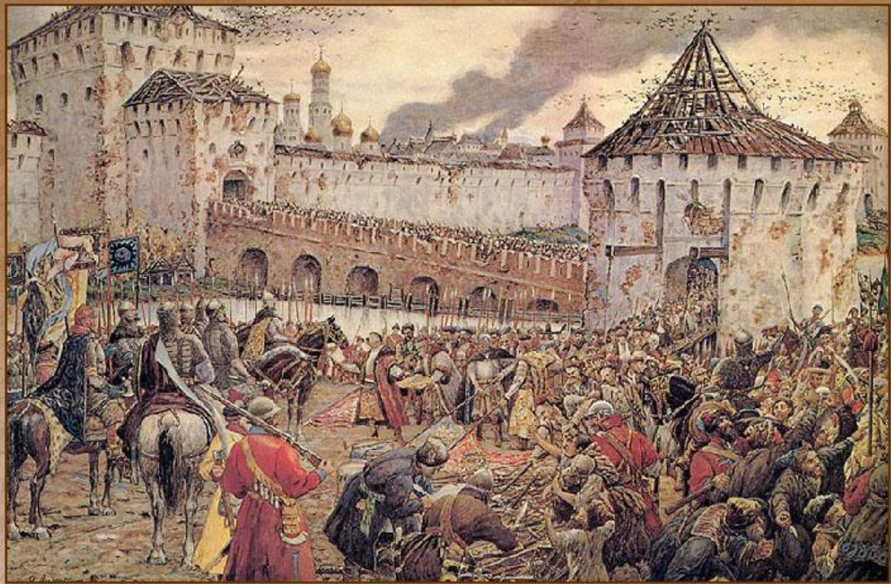
Изгнание польских интервентов из Московского Кремля в 1612 г.