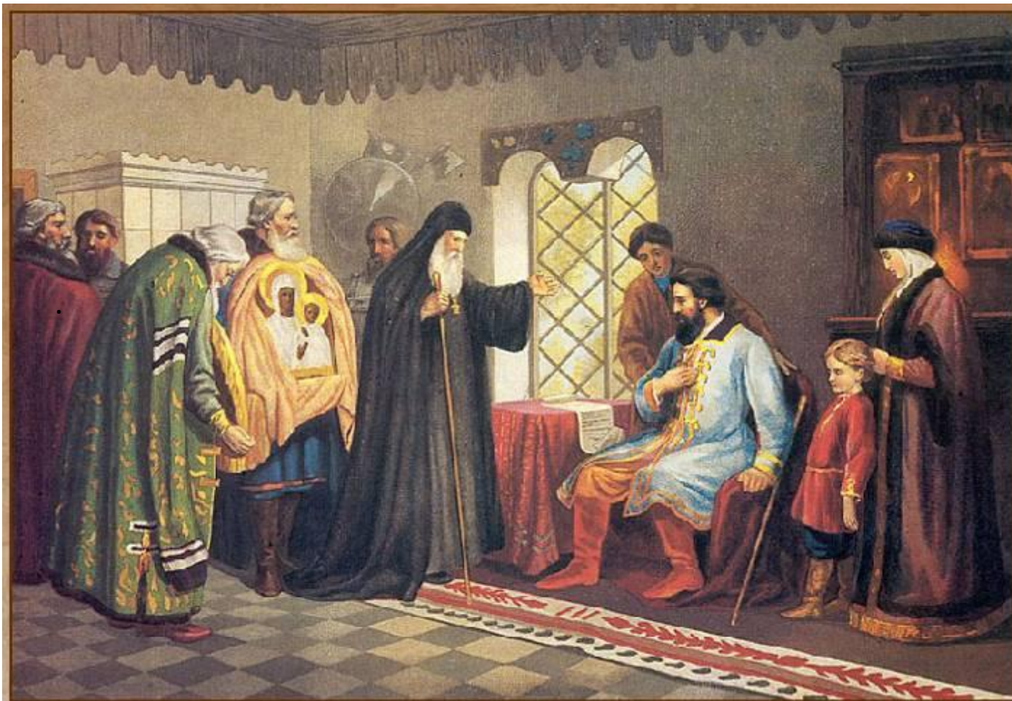
Нижегородские послы у князя Дмитрия Пожарского. 1611 г.

Военным руководителем ополчения стал князь Д. М. Пожарский.