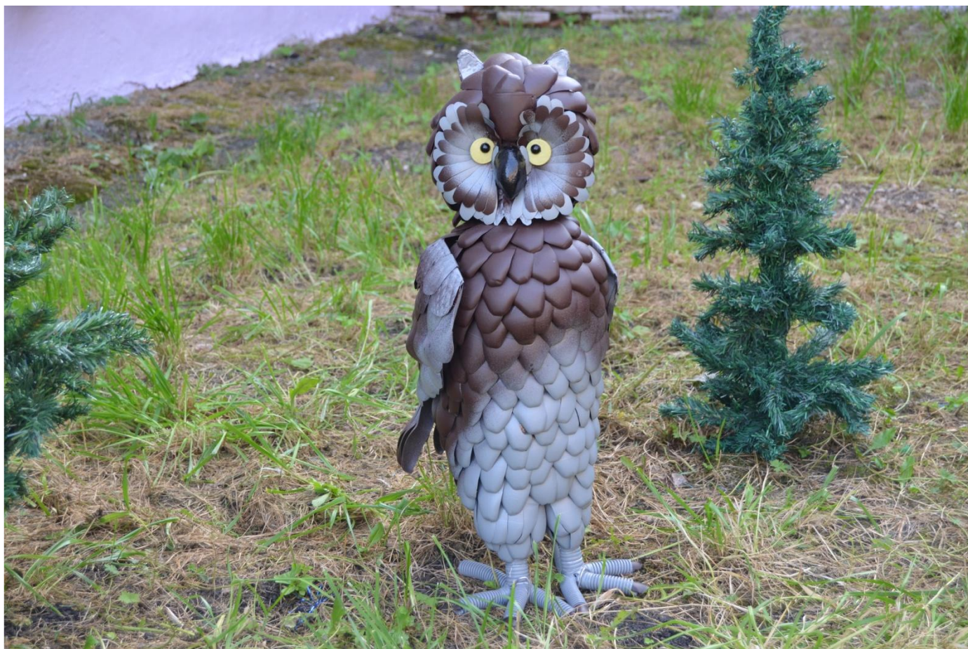
Сова гр «Рябинка»