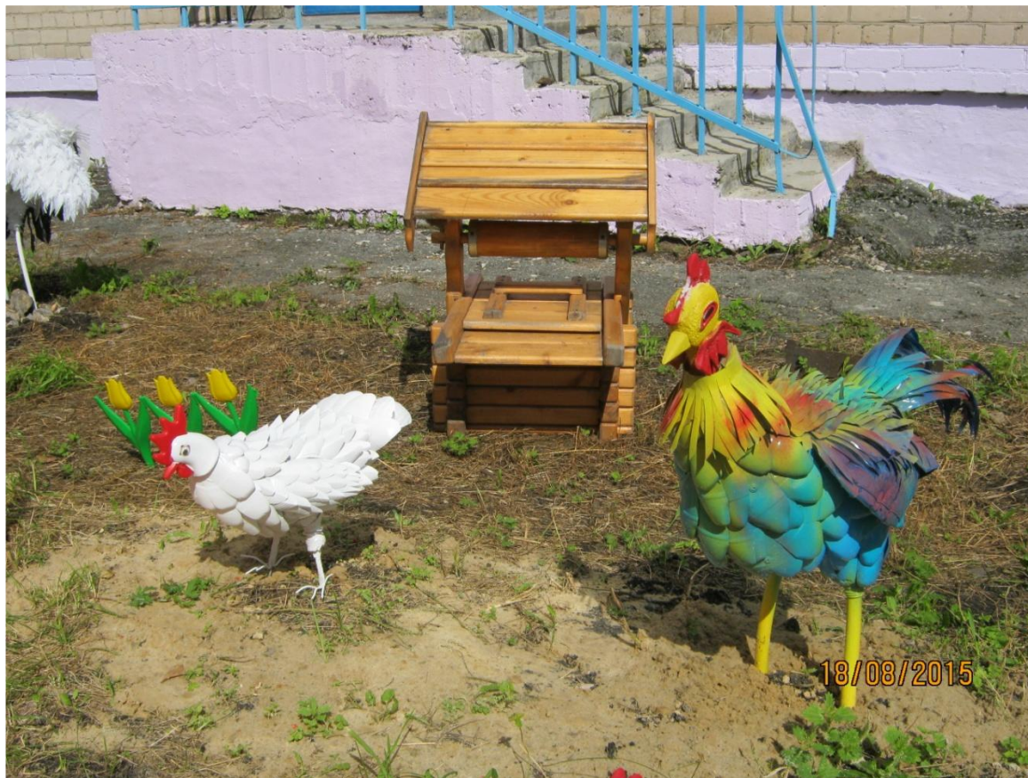
Курица «Ромашка» Петух «Солнышко»