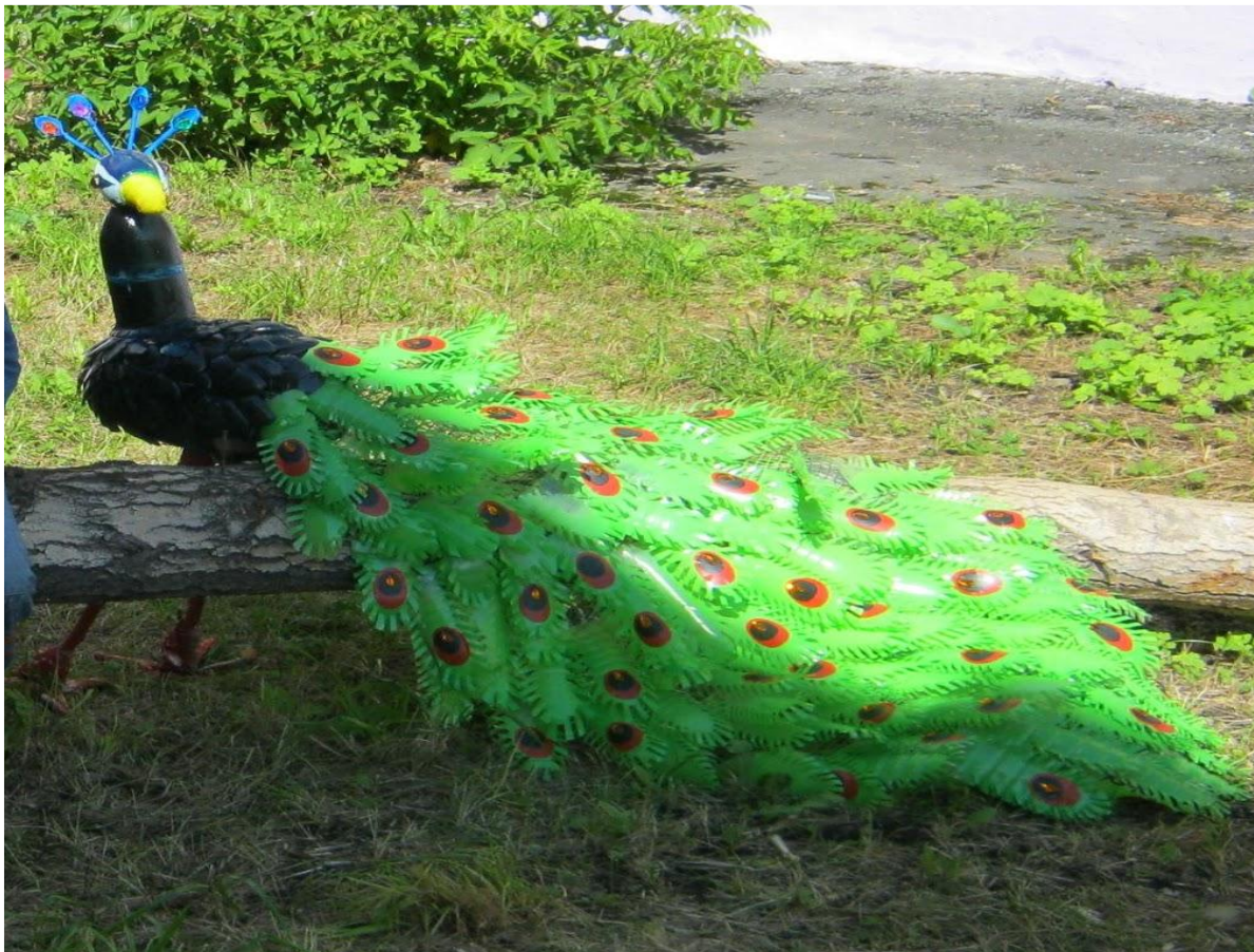
Павлин гр. «Березка» и гр. «Смородинка»