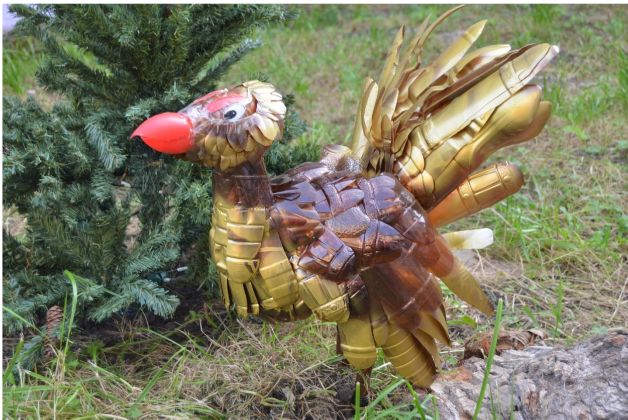
Глухарь гр. «Грибок» и гр. «Светлячок»