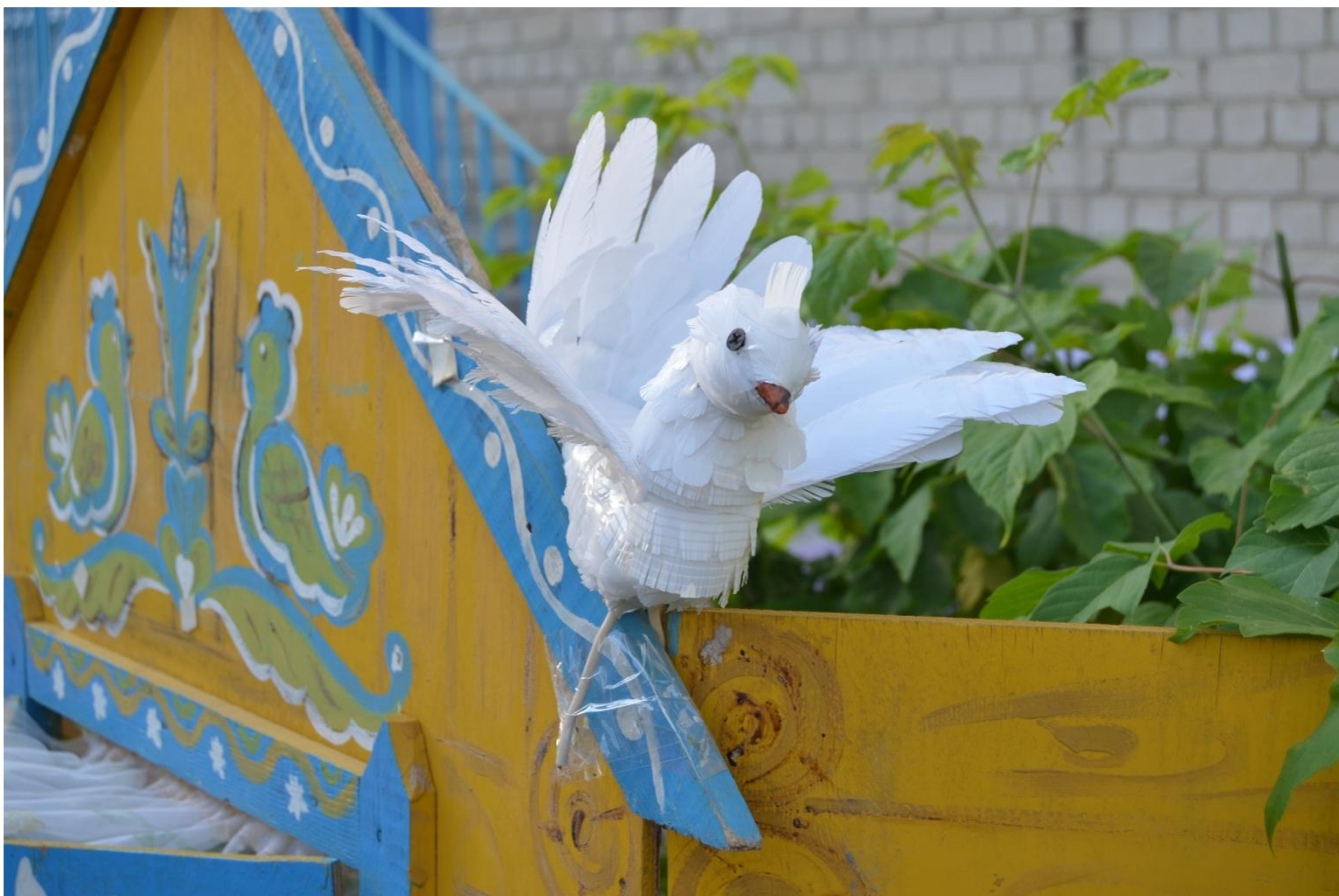
Голубь гр. «Василек»