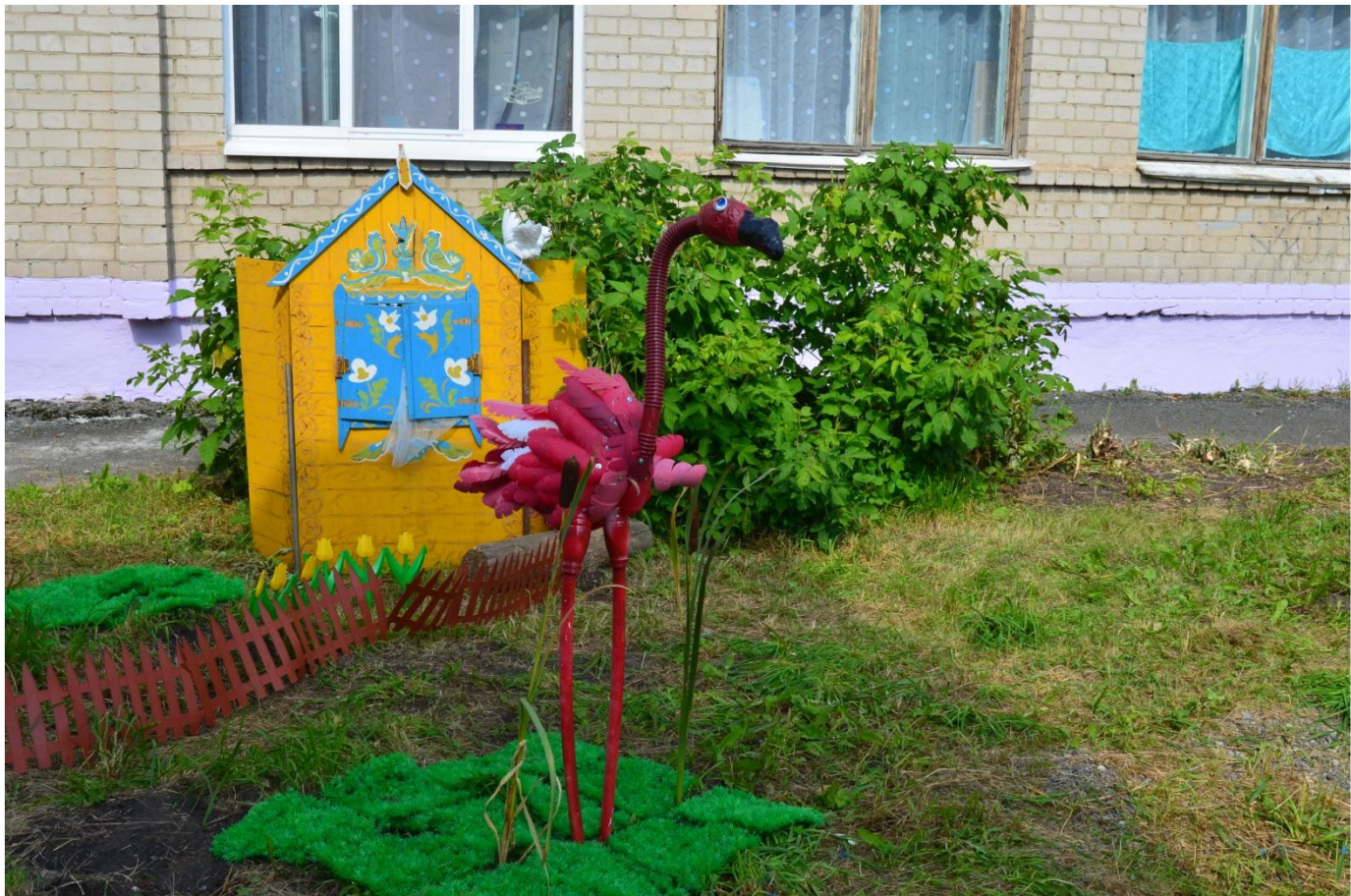
Фламинго гр. «Тополек»