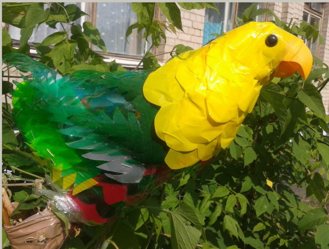
Попугай гр. «Мотылёк»