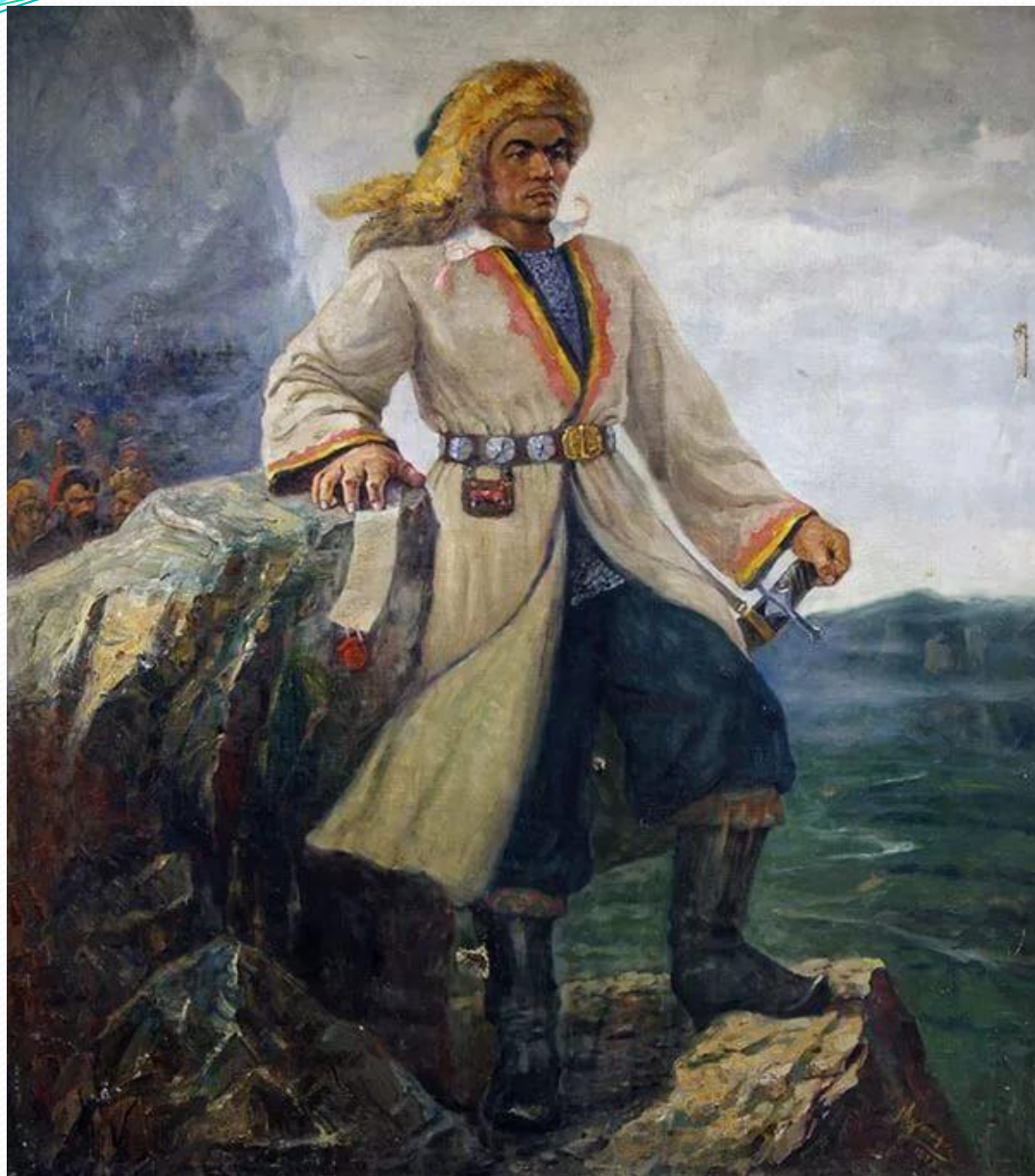
Ғ. С. Мостафин “Салауат Юлаев” картинаһы