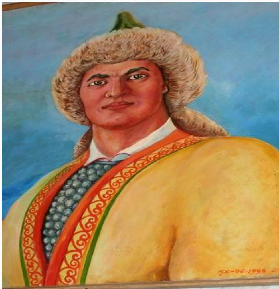
Салауат Юлаев (1774-1800)