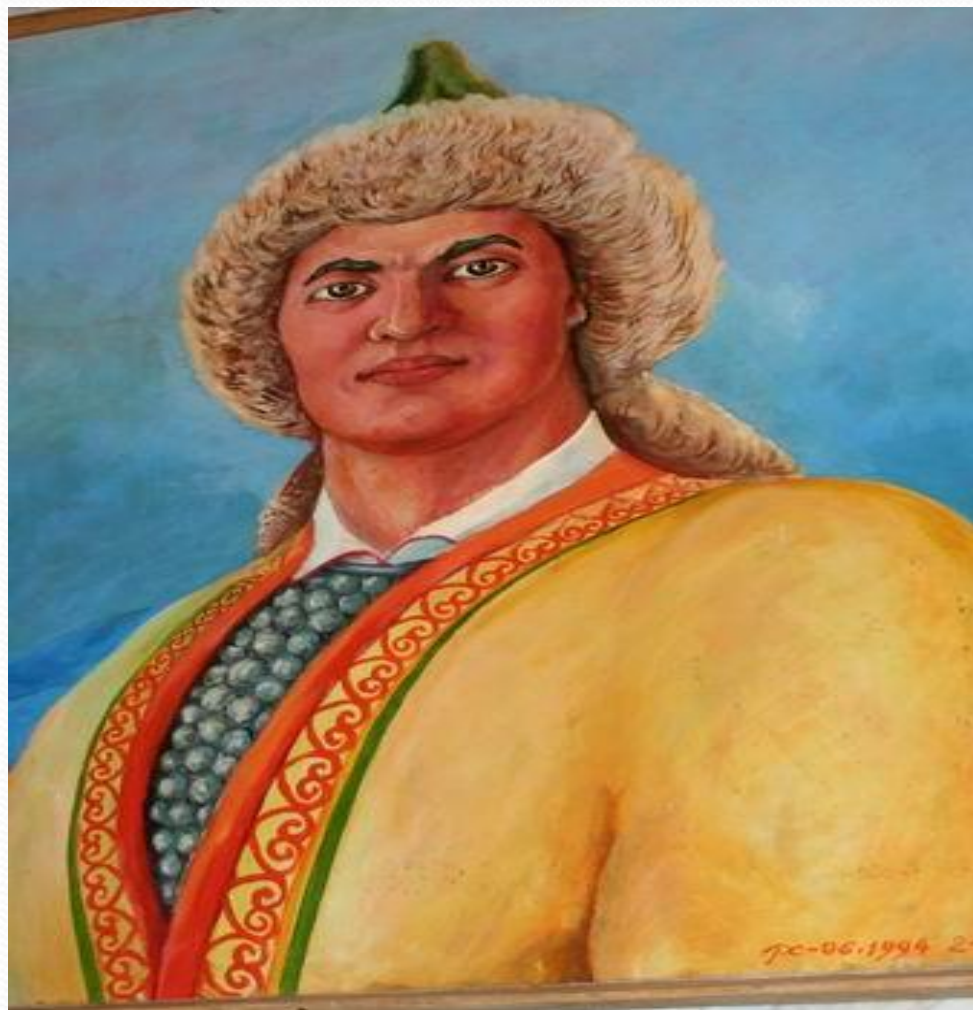
Салауат Юлаев (1774-1800)