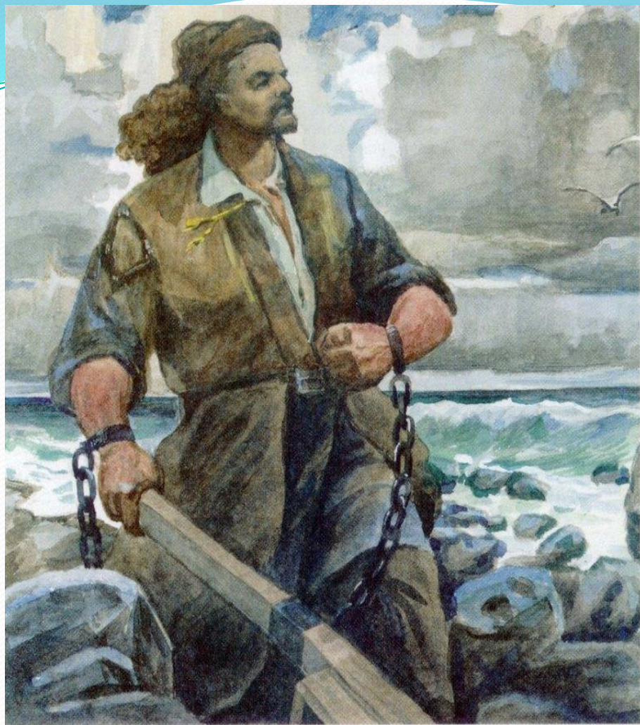
Р. Ишбулатов. «Непокоренная воля»