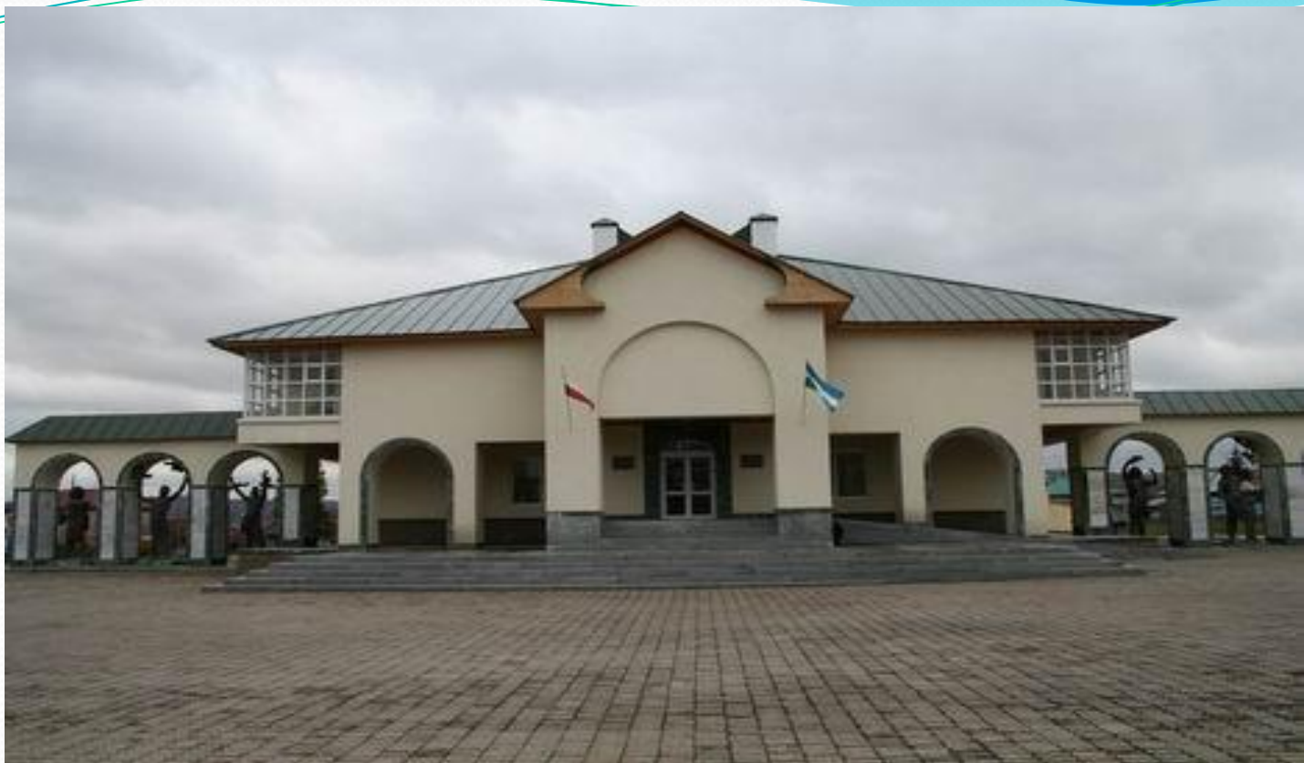
С. Юлаевтың Малаяззағы йорт- музейы