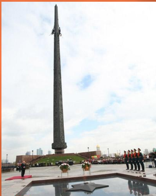
Вечный огонь (Огонь Памяти и Славы) на Поклонной горе

Два других Вечных огня в Москве установлено на Поклонной горе и Преображенском кладбище.