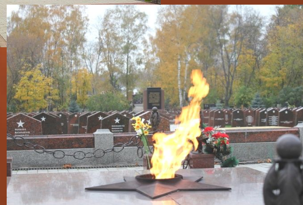
Вечный огонь на Преображенском кладбище