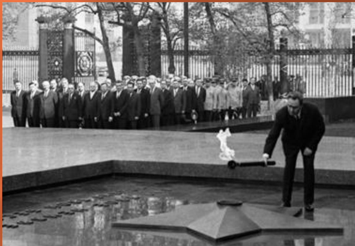
Л.И. Брежнев зажигает Вечный огонь на могиле Неизвестного солдата (1967 г.)

Мемориальный архитектурный ансамбль «Могила Неизвестного Солдата» был открыт 8 мая 1967 года.