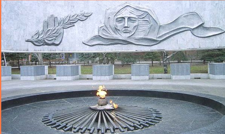
Вечный огонь и Пост №1 в г. Ростов-на-Дону (являются частью мемориального комплекса «Павшим воинам»)

Интересно, что Пост №1 в городе Ростов-на-Дону является одним из немногих, а может и единственным местом в России, где почетный караул несут старшеклассники. Смена караулов проходит каждые 15-20 минут. Караульные одеты в парадную форму и вооружены автоматами. Школьники изучают устав, занимаются маршировкой, строевыми учениями и принимают торжественную клятву. Пост действует с 1975 года.