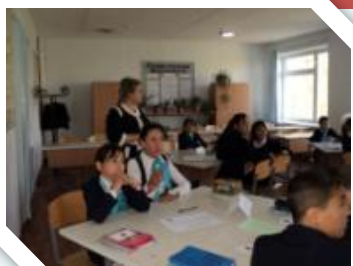
Активное участие учеников в процессе обучения

Джером Брунер изучал возможности взаимосвязи умственного процесса с преподаванием, подчеркивая важность обучения через