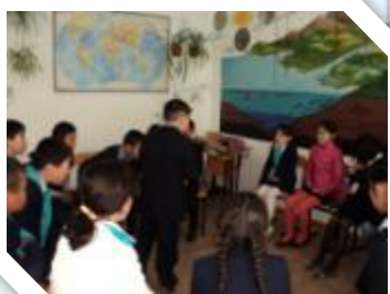
Создание коллаборативной среды учитывающей ВОУ