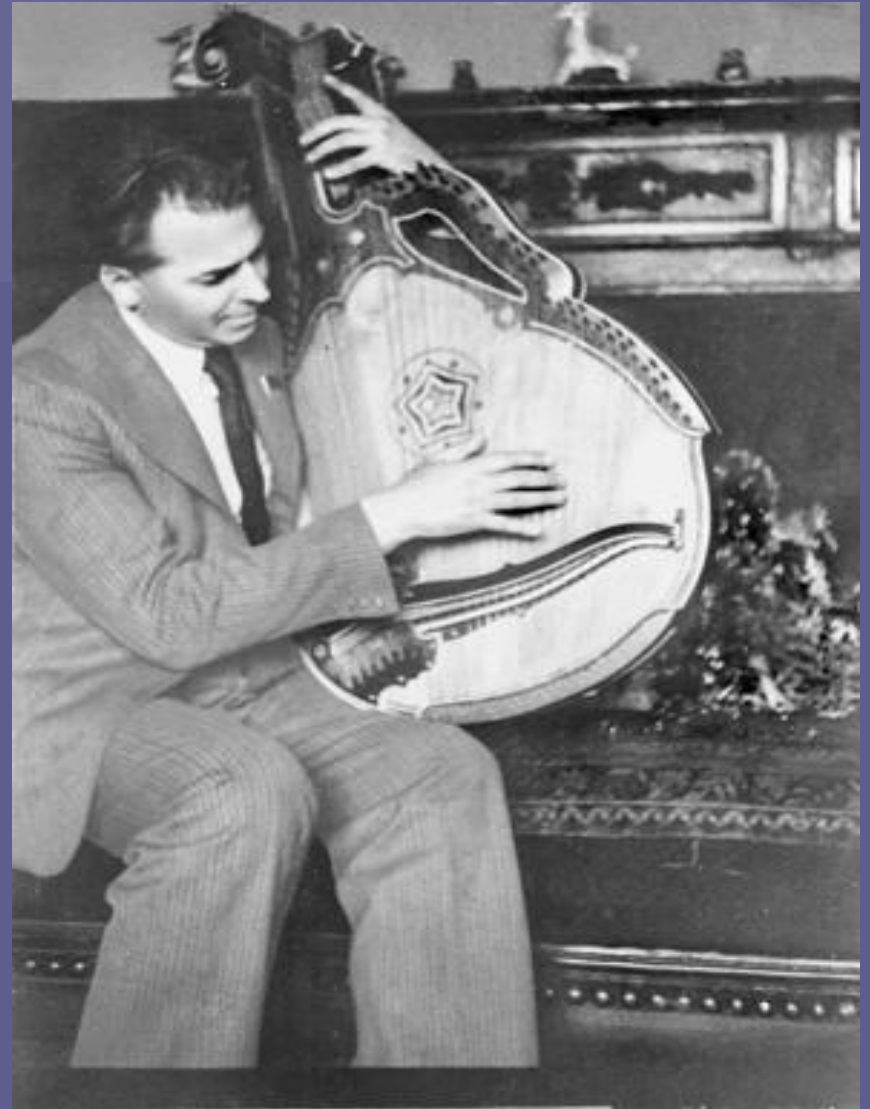
Павло Тичина з бандурою, 4 червня 1946 р.

У галузі поезії, прози, публіцистики, а також у науково- критичних працях Павло Тичина виявив себе одним із найосвіченіших радянських письменників, чия ерудиція охоплювала суміжні з літературою види мистецтва — музику і живопис.