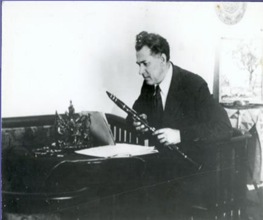
Павло Тичина з кларнетом, 1940-ві роки.

Павло Григорович чудово грав на кларнеті, та й у словах вловлював особливе, музичне звучання. Можливо, тому так легко давалося йому вивчення іноземних мов (він вільно володів п'ятнадцятьма).