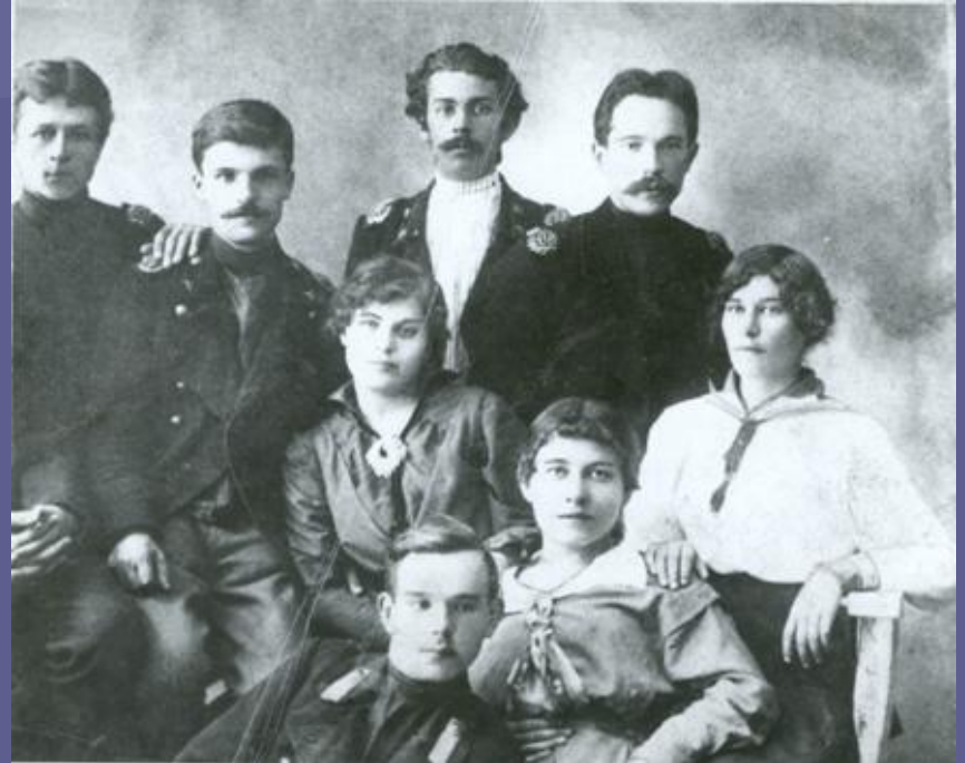
Павло Тичина серед друзів, 1913--1914 рр.

Перші друковані твори молодого поета з'явилися 1912 р.