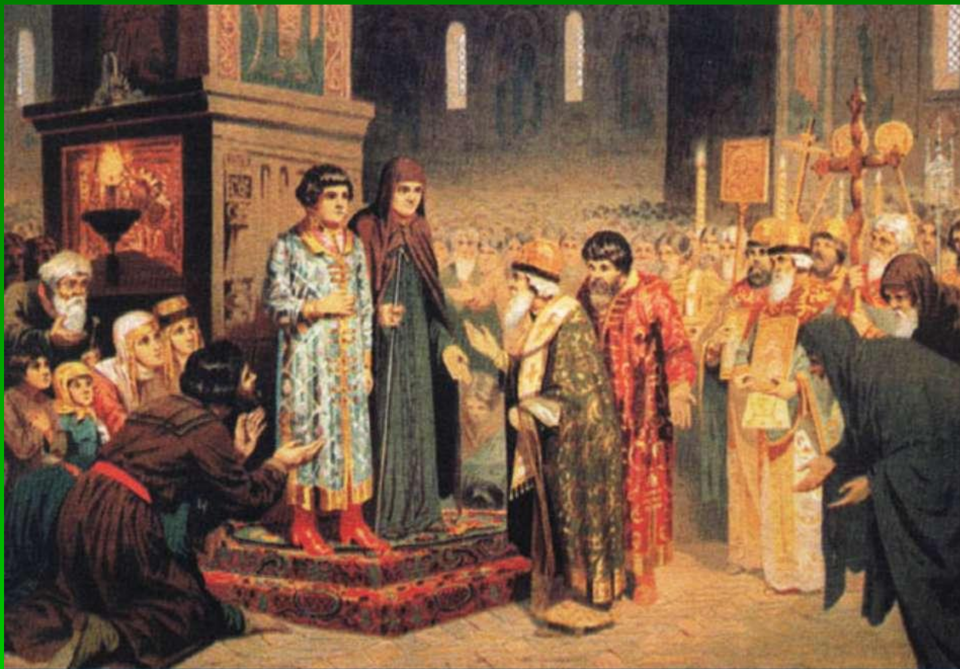
■ А. Кившенко. "Избрание Михаила Федоровича Романова на царство"