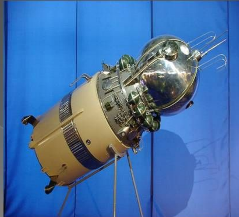
Модель космического корабля «Восток»

Сегодня этот день (12 апреля) отмечается в России и во многих других странах мира, как Всемирный день авиации и космонавтики.