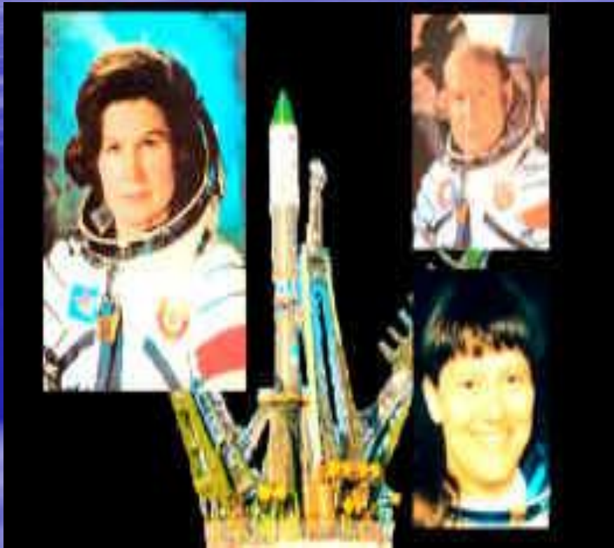
В. Терешкова А. Леонов С. Савицкая