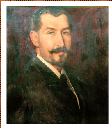
Антонио Бернар-Жан Марфан (1858–1942)