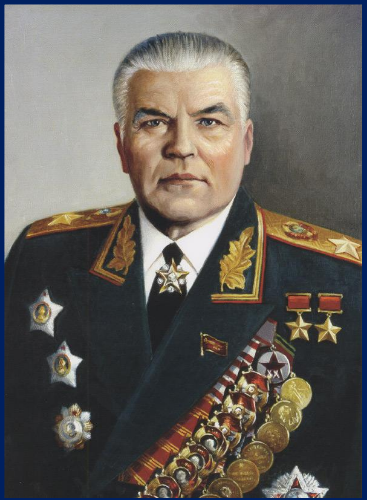
Малиновский Родион Яковлевич (1898-1967)

Характерной чертой настоящего полководца является неординарность замысла и действий, уход от шаблона, военная хитрость, в чем преуспел великий полководец А. В. Суворов. В годы Великой Отечественной войны этими качествами отличался Малиновский Родион Яковлевич. На протяжении почти всей войны примечательной особенностью его полководческого таланта было то, что он в замысел каждой операции закладывал какой-либо неожиданный для противника способ действий, умел целой системой хорошо продуманных мер ввести противника в