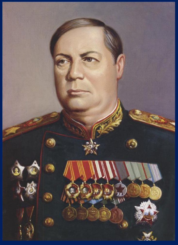
Толбухин Федор Иванович (1894-1949)

В памяти сослуживцев и подчиненных запечатлелись такие замечательные черты этого доблестного сына России, как верность долгу и беспредельная преданность Родине, добросовестность и трудолюбие. Для успешного руководства войсками немаловажное значение имели его большой опыт оперативной работы, глубокое понимание ее сущности и важности. По умению опереться на свой штаб, максимально использовать его возможности вряд ли можно сыскать равного Федору Ивановичу среди командующих фронтами Великой Отечественной войны. Демократизм начальника в повседневной жизни, при выработке решения на операцию сочетался с его твердостью и настойчивостью при достижении поставленной цели.