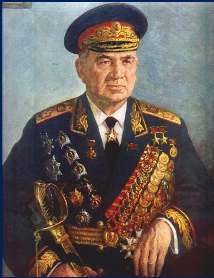
Василий Иванович Чуйков (1900-1982)

В годы Великой Отечественной войны Василий Иванович Чуйков командовал 62-й (8-й гвардейской) армией, которая навечно вписана в летопись героической обороны города Сталинграда. Командарм Чуйков ввел в войска новую тактику- тактику ближнего боя. В Берлине В. И.Чуйкова называли: «Генерал – Штурм». После победы в Сталинграде были удачно проведены операции: Запорожье, форсирование Днепра, Никополь, Одесса, Люблин, форсирование Вислы, Познаньская цитадель, Кюстринская крепость, Берлинская и др.