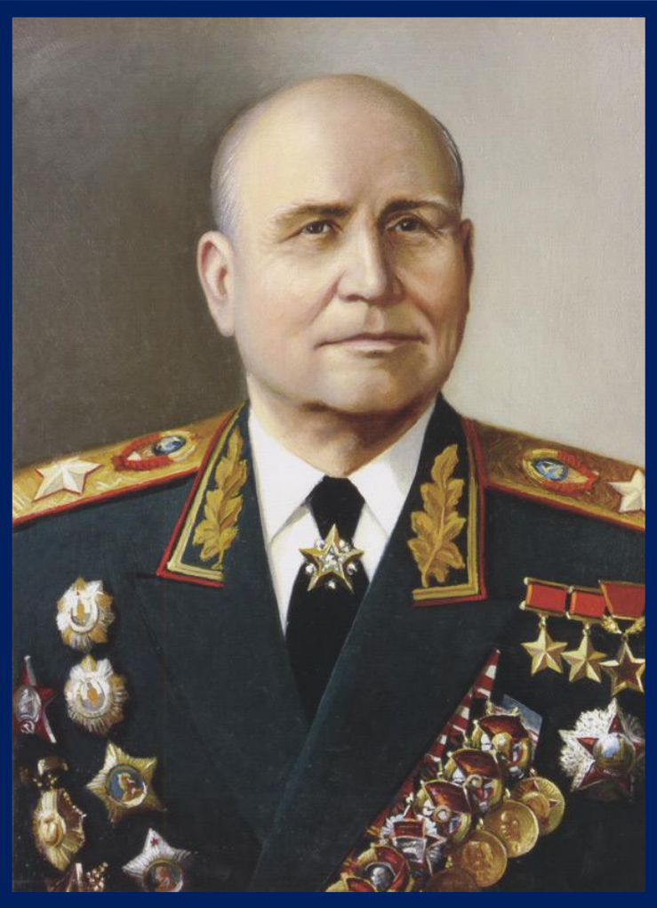
Конеv Иван Степанович (1897-1973)

Важной чертой полководческого таланта является интуиция, позволяющая добиться внезапности удара. Этим редким качеством обладал Конеv Иван Степанович. Его полководческий талант наиболее убедительно и ярко проявился в наступательных операциях, в ходе которых было одержано много блестящих побед. При этом он всегда стремился не ввязываться в затяжные бои в больших городах и обходными маневрами вынуждал противника покинуть город. Это позволяло ему уменьшить потери своих войск, не допустить больших разрушений и жертв среди мирного населения