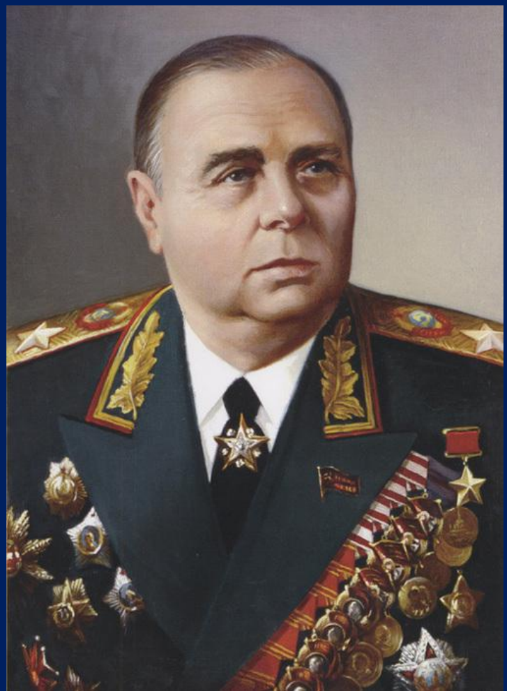
Кирилл Афанасьевич Мерецков (1897-1968)

В годы Великой Отечественной войны Кирилл