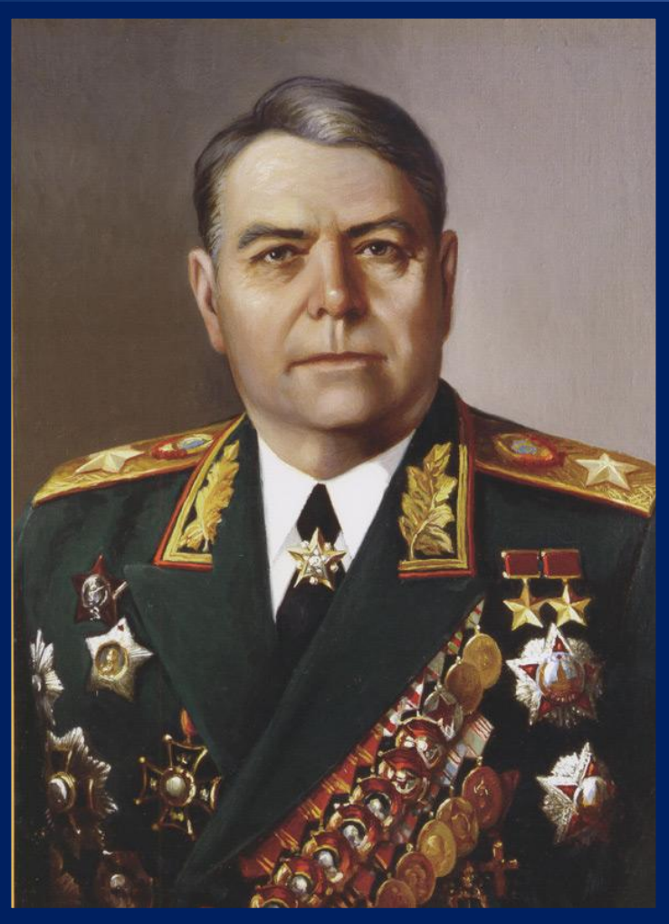
Александр Михайлович Василевский (1895-1977)

Александр Михайлович Василевский - выдающийся военачальник стратегического плана. Будучи во время войны начальником Генштаба на протяжении 34-х месяцев, А. М. Василевский только 12 месяцев был в Москве, в Генштабе, а 22 месяца находился на фронтах. Г. К. Жуков и А. М. Василевский обладали развитым стратегическим мышлением, глубоким пониманием обстановки. Именно это обстоятельство привело к одинаковой оценке обстановки и выработке дальновидных и обоснованных решений по контрнаступательной операции под Сталинградом, к переходу к стратегической обороне на Курской дуге и в ряде других