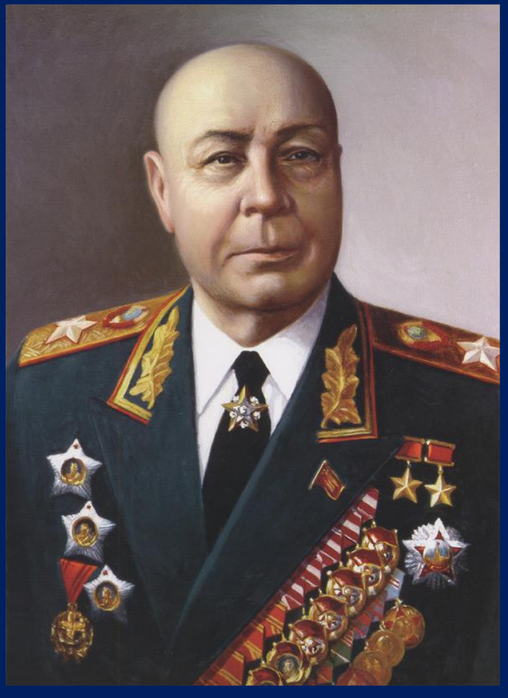
Тимошенко Семён Константинович (1895-1970)

Испытав на себе весь гнев Сталина в первые дни кошмарных провалов на фронтах, Тимошенко Семён Константинович попросил направить его на наиболее опасный участок. Впоследствии маршал командовал стратегическими направлениями и фронтами. Под его командованием шли тяжелые оборонительные бои на территории Белоруссии в июле - августе 1941 года. С его именем связаны героическая оборона Могилева и Гомеля, контрудары под Витебском и Бобруйском. Под руководством Тимошенко развернулось самое большое и упорное сражение первых месяцев войны - Смоленское. В июле 1941 г. войска Западного направления под командованием маршала Тимошенко остановили наступление группы армий "Центр"..