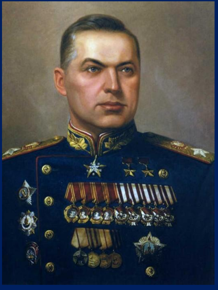
Константин Константинович Рокоссовский

Черта полководческого таланта Константина Константиновича Рокоссовского - способность к разумному риску, что являлось неоценимым качеством советских полководцев. Одна из замечательных страниц полководческой деятельности К. К. Рокоссовского - Белорусская операция, в которой он командовал войсками 1-го Белорусского фронта.