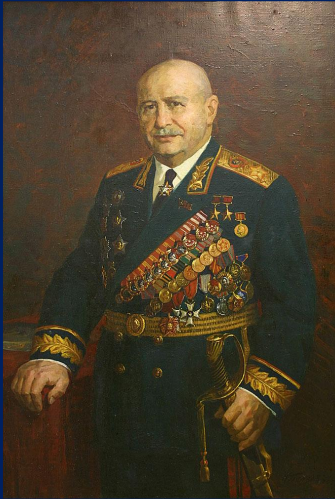
Иван Христофорович Баграмян (1897-1982)

Войска под командованием маршала Ивана Христофоровича