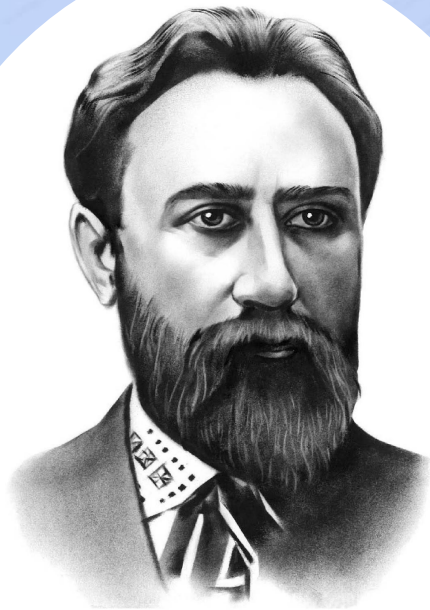
Борис Грінченко (1863—1910)

Підготовлена і видана чотиритомна праця „Словник української мови”, тому не випадково вона вважається науковим подвигом. Тож, мабуть, є справедливим, що письменник обрав для себе псевдонім - Вартовий. Усе своє недовге життя він свідомо стояв на варті культури рідного краю, народу, боровся, як міг, за його соціальні та політичні права.