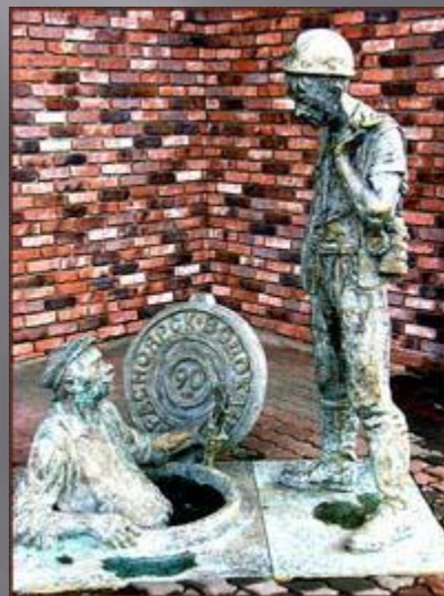
Скульптурная композиция, посвящённая слесарю “Дяде Яше” и установленная в Красноярске, признана самым забавным памятником России.