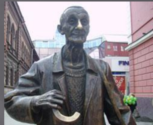
Памятник художнику Паздееву