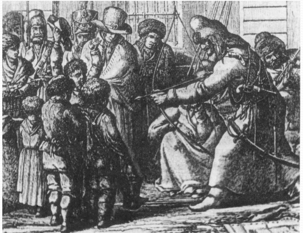
Башкорт яугиры Берлин урамында ян менән ук атыузы күрһәтә. Немец гравюраһы. Мәскәүгә Үзәк тарих музейындағы Дашков коллекцияһынан.