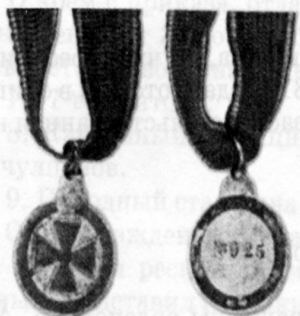
Знак ордена Святой Анны 4-й степени «За храбрость» для христиан и иноверцев