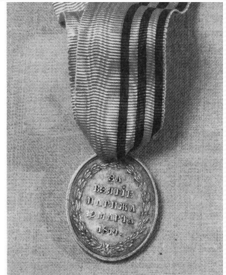
Медаль "за взятие Парижа"