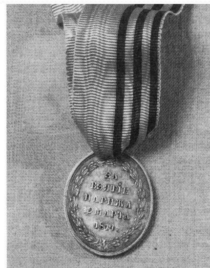
Медаль "за взятие Парижа"