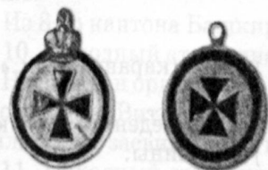
Знак отличия ордена Святой Анны (Аннинская солдатская медаль)