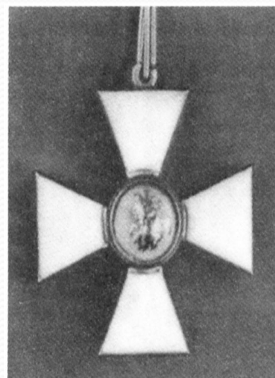
Знак (крест) ордена Святого Георгия 4-й степени