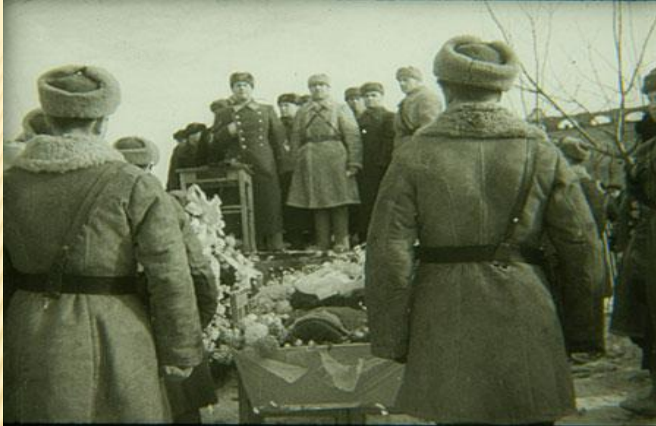
Перед могилой С.Н. Перекальского –, выступает генерал Иван Данилович Черняховский