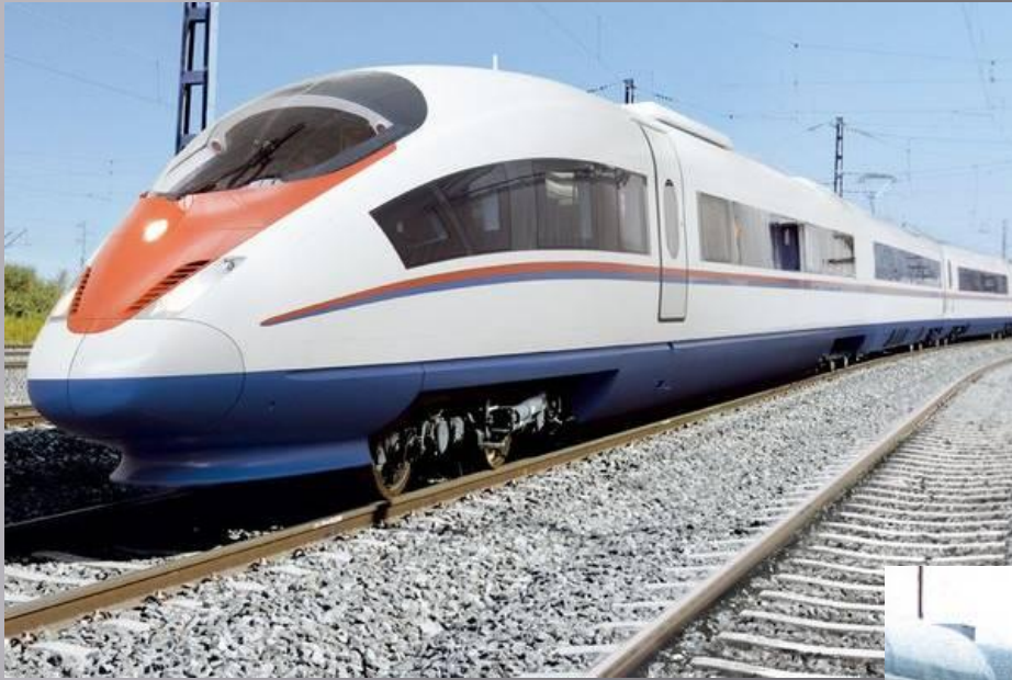
Поезд дальнего следования