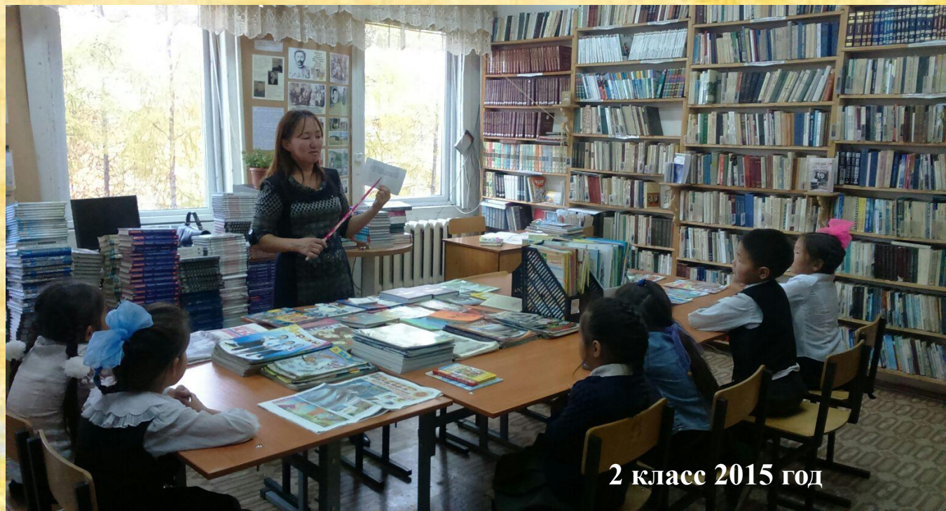
2 класс 2015 год