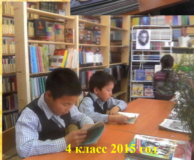
4 класс 2015 год