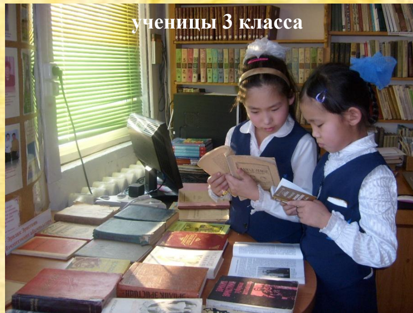
ученицы 3 класса