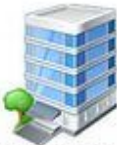
плата за аренду