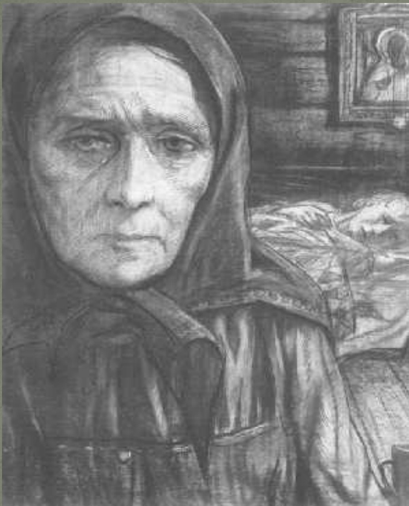
«Орина, мать солдатская»

Любовь к матери описана во многих стихах поэта: "Родина", "Мать", "Баюшки-баю", "Рыцарь на час" и др. Это стихотворения автобиографического характера, они описывают людей той эпохи, их взаимоотношения, их нравы и обычаи.