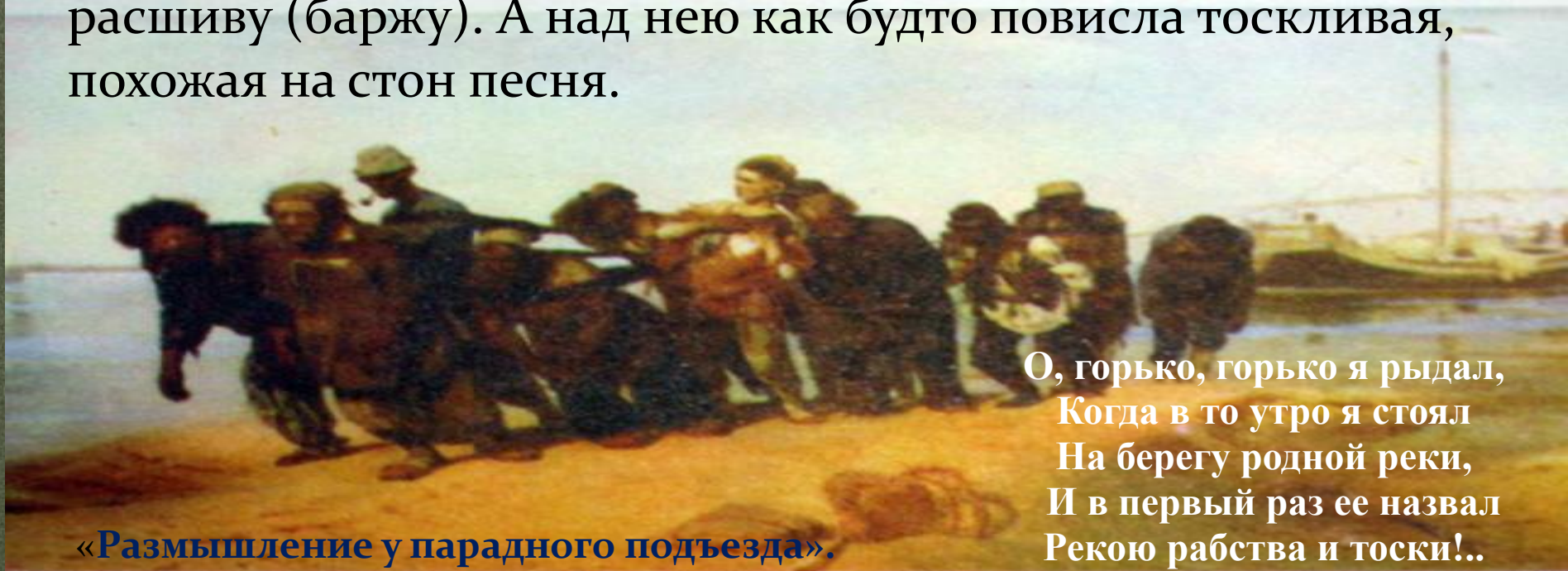
«Размышление у парадного подъезда».

О, горько, горько я рыдал, Когда в то утро я стоял На берегу родной реки, И в первый раз ее назвал Рекою рабства и тоски!..