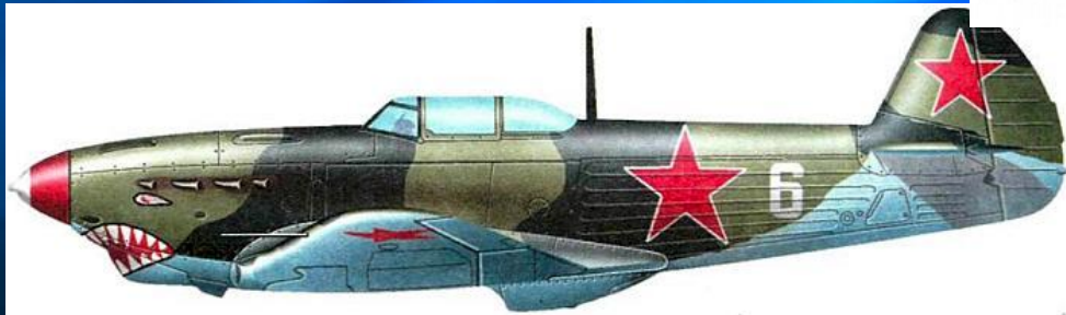
Як-1 русский истребитель (ОКБ Яковлева)