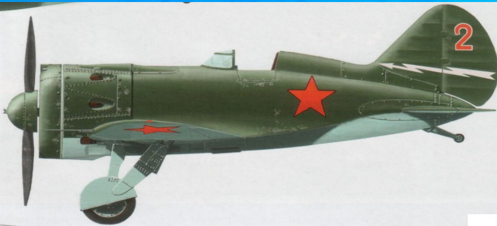
И-16- русский истребитель (ОКБ Поликарпова)