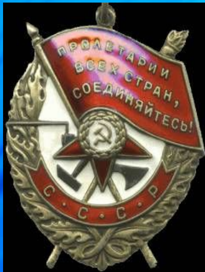
Орден Красного Знамени