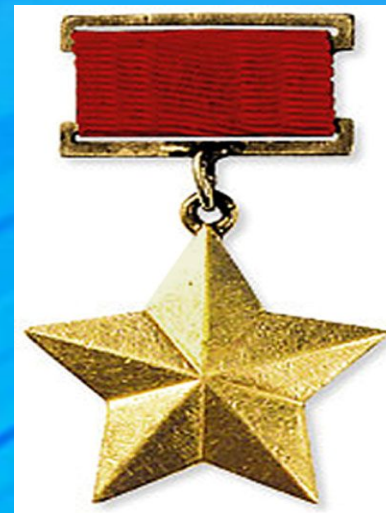
Медаль «Золотая Звезда»