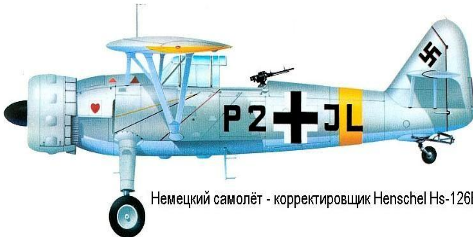
Немецкий самолёт - корректировщик Henschel Hs-126B.