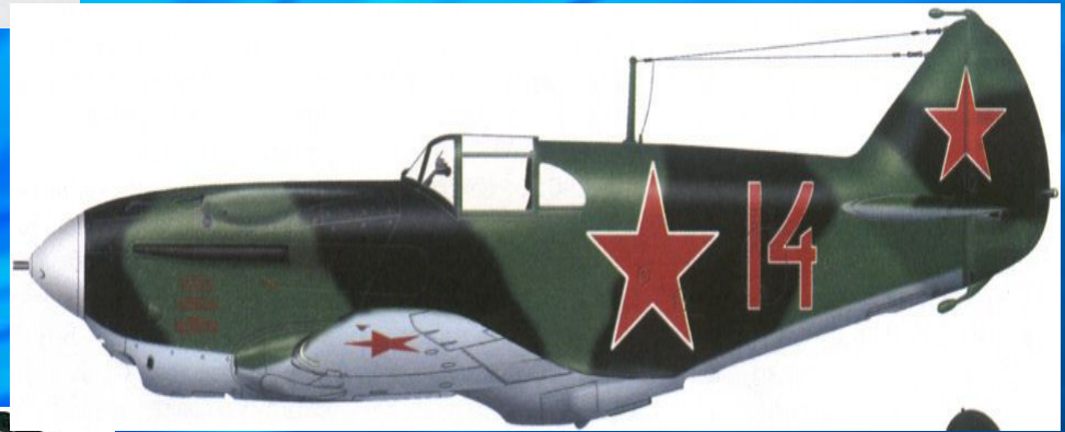
ЛаГГ-3 русский истребитель (ОКБ Горбунова, Лавочкина, Гудкова)