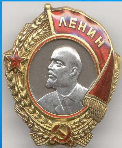
Орден Ленина (1936-1943)