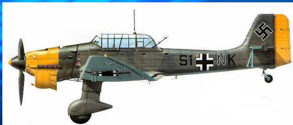
Юнкерс 87 (Ю-87) немецкий штурмовик