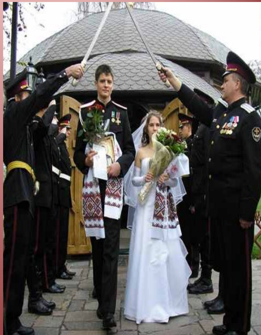
Казачья свадьба начала XX-го и начала XXI-го века.