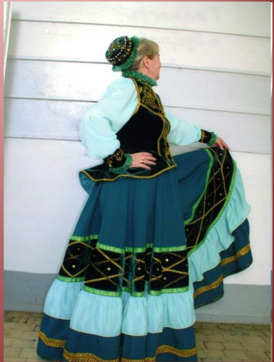
донская казачка в "парочке" - юбке и кофте