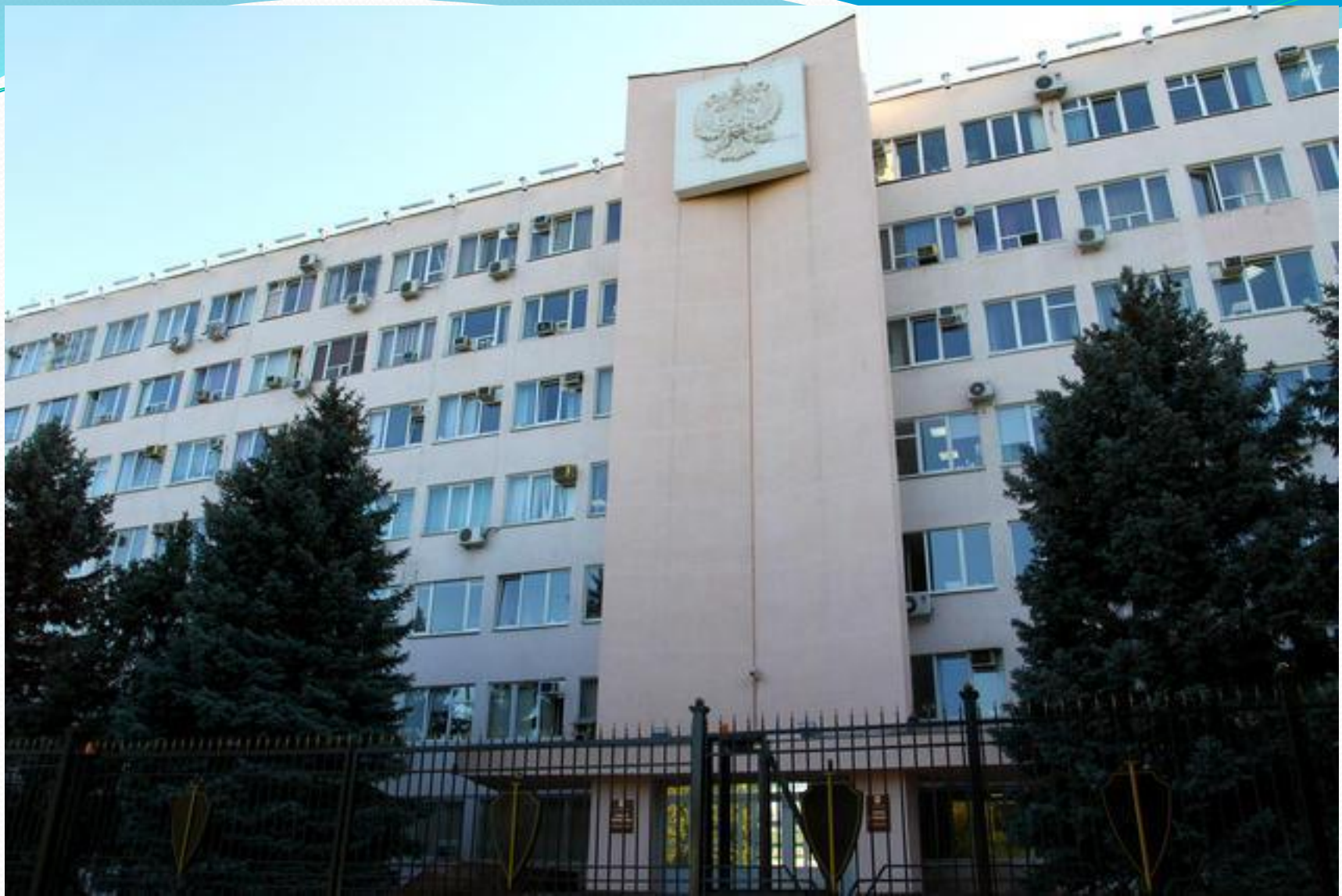
● ГУ МВД по Краснодарскому краю