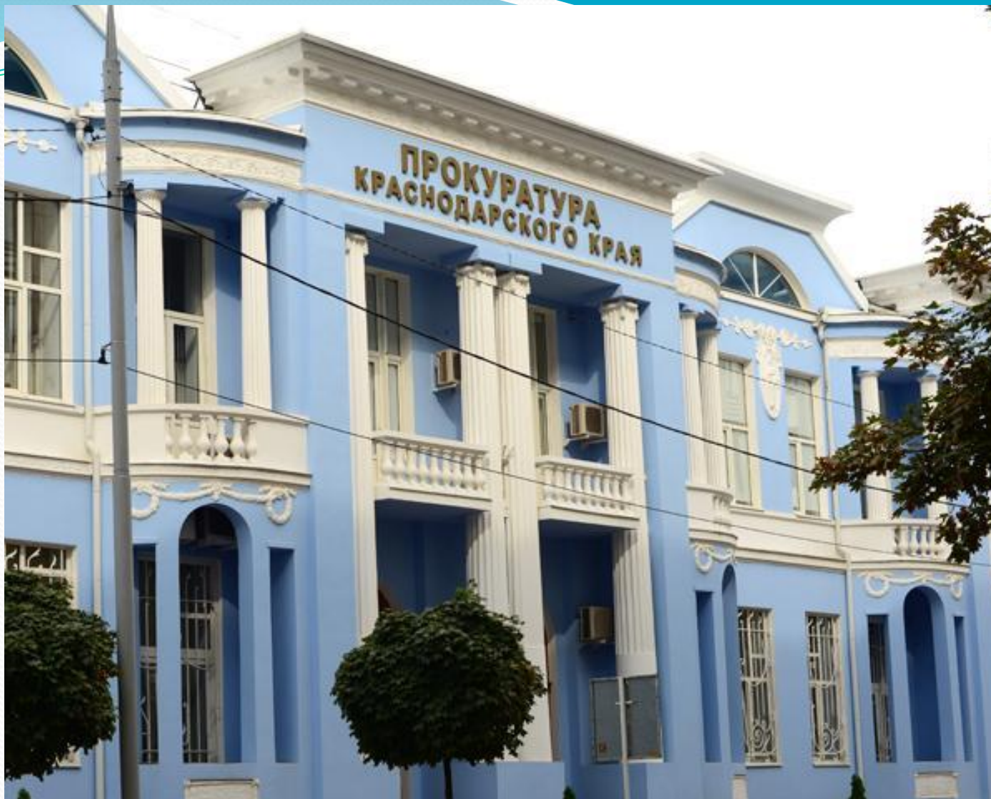
● Прокуратура Краснодарского края