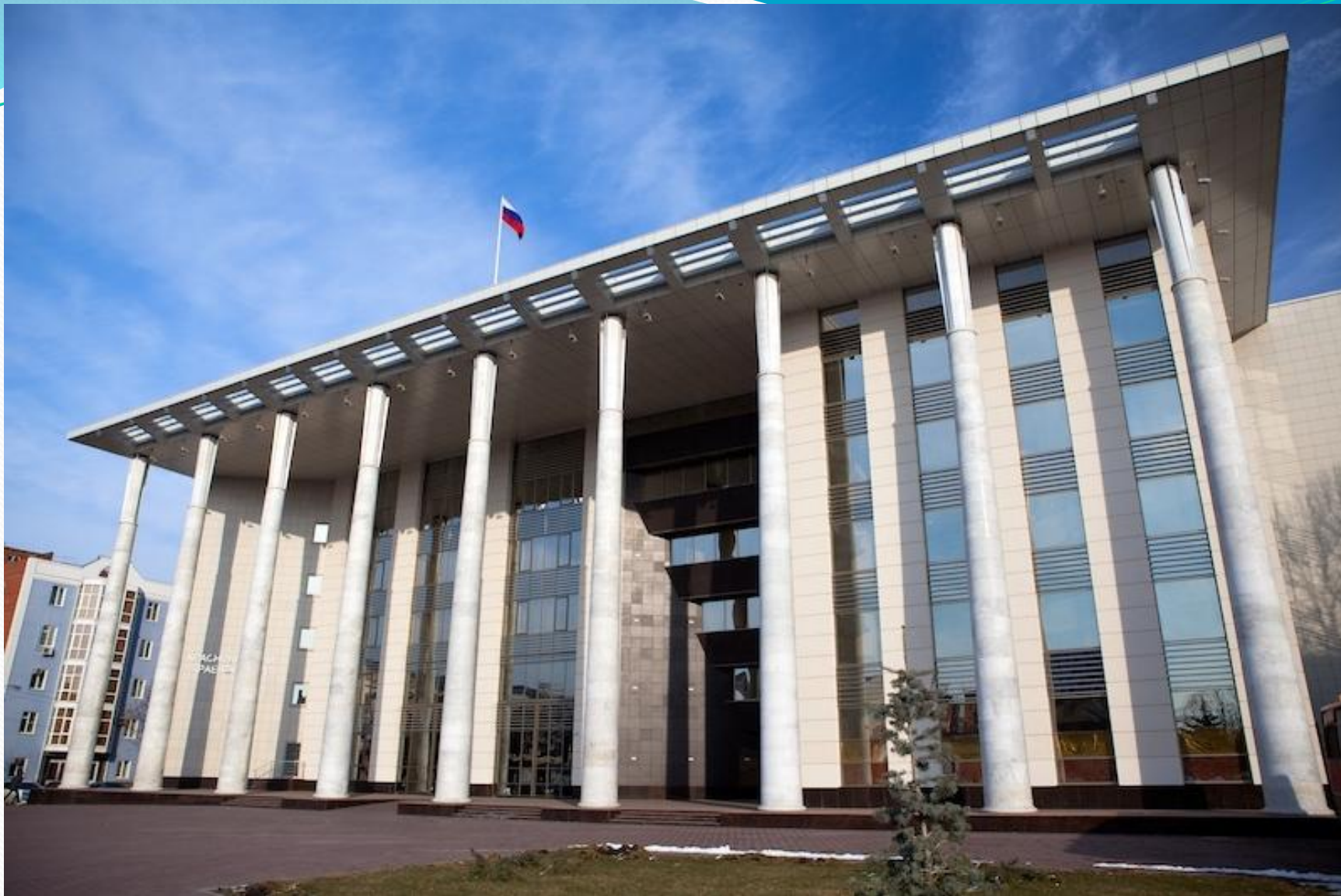
● Краснодарский краевой суд