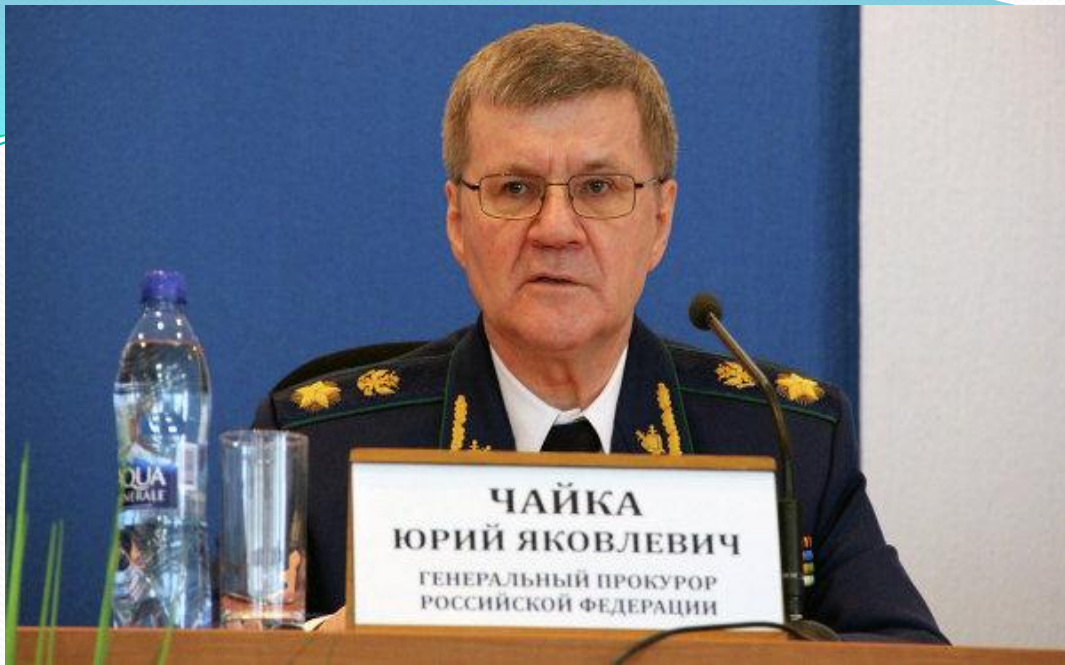
Генпрокурор Чайка Юрий Яковлевич