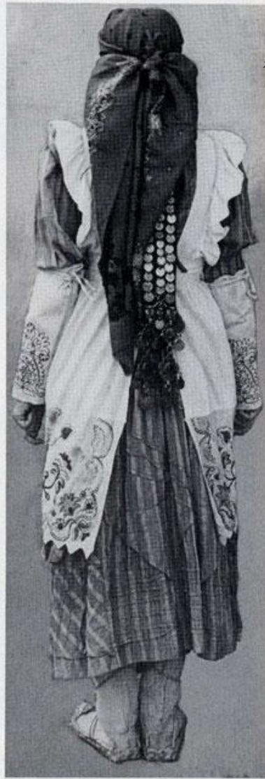
215—216. Молодая крестьянка в рабочем наряде. Нач. XX в.