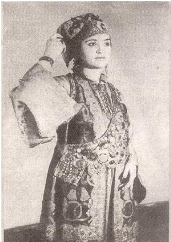
Казанская татарка в расшитом головном уборе — калфаке и перевязи с камнями, жемчугом и монетами — бути. (фото 1907 г.).

Казанская татарка в расшитом головном уборе — калфаке и перевязи с камнями, жемчугом и монетами — бути.