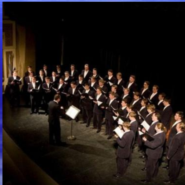
Мужской хор Московского Сретенского монастыря