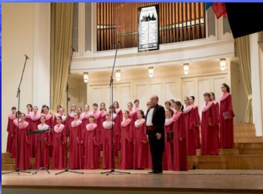
Женский хор Смоляного собора