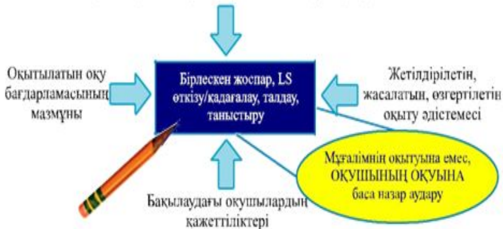
2-сурет. Lesson Study қағидамдары

Оқушыларды оқыту әдістемесін жетілдіру/әзірлеу