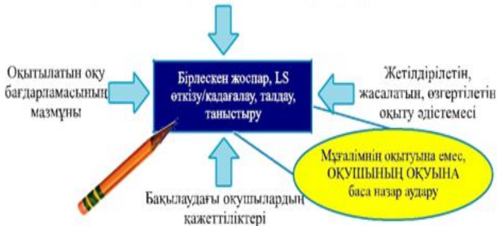
2-сурет. Lesson Study қағидамдары

Оқушыларды оқыту әдістемесін жетілдіру/әзірлеу