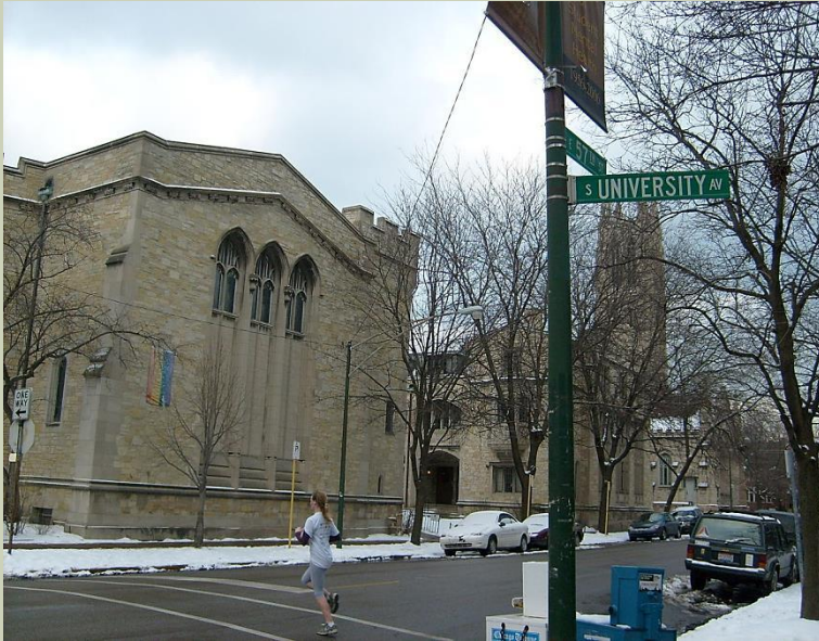
Пересечение 57-й улицы и университетской авеню в кампусе Университета

В 1929 году Роберт Мейнард Хатчинс стал пятым президентом университета, начиная период резких изменений. За свой 24-летний срок на посту Хатчинс ликвидировал университетскую команду американского футбола, подчёркивая превосходство учебы над спортом, создал программу гуманитарного образования под названием «Общая основа» (англ. Common Core), организовал современную аспирантуру из четырех кафедр. В 1934 году Хатчинс внёс предложение об объединении Северо-Западного университета с Чикагским, однако в конечном итоге оказалось безуспешным. Также во время его срока был достроен Медицинский центр при университете, куда вскоре поступили первые студенты. Комитет о социальном мышлении — учреждение, характерное Университету — тоже был создан в это время.