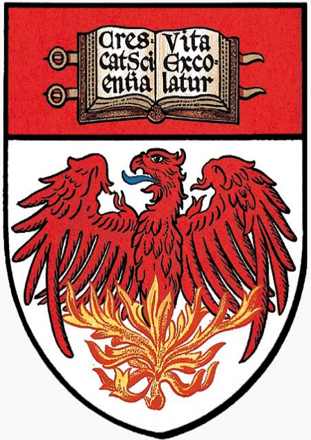
Эмблема Чикагского университета

Чикагский университет (англ. University of Chicago) — частный исследовательский университет в городе Чикаго, штат Иллинойс, США, основанный в 1890 году. Университет является одним из наиболее известных и престижных высших учебных заведений благодаря своей влиятельности в сферах науки, общества и политики.