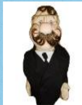
Администратор торгового зала, товаровед