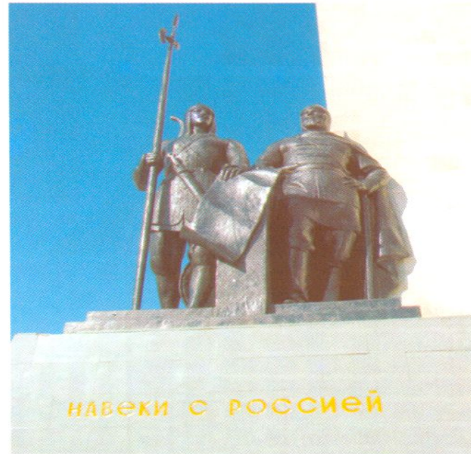
Памятник «Навеки с Россией» на площади Дружбы.