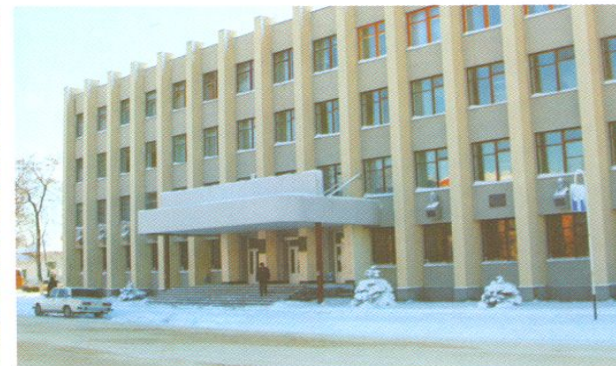
Институт физической культуры.