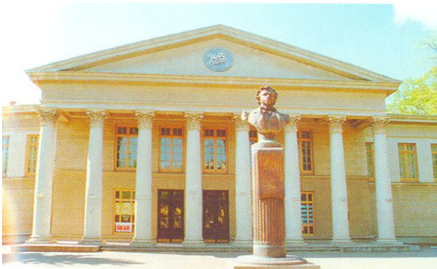
Театр им. Пушкина.