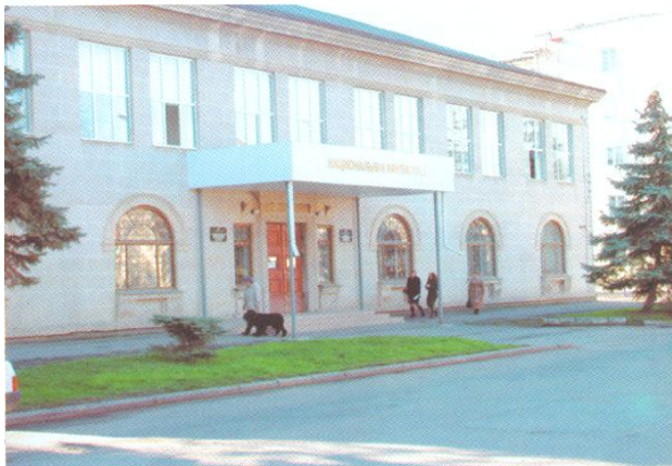
Республиканская библиотека им. Пушкина.