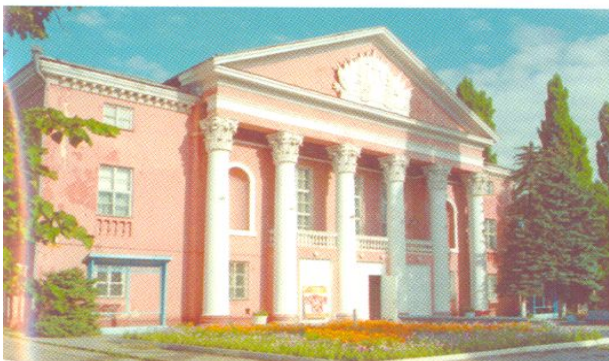
Дом культуры «Дружба».