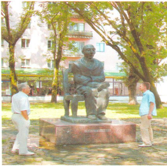
Памятник Т. Керашеву.