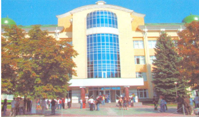
Адыгейский государственный университет.