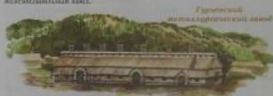
Гурьевский металлургический завод

На Сибире появились и первые золотые прииски. Не самые богатые месторождения прииски были открыты в Минусинской тайге. Своей давней историей – у Гурьевского завода. Он был построен в 1816 году. Сначала там работали серебрян, затем его перенесли в железнодобывающий завод.