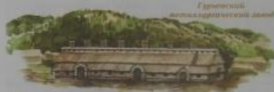
Гурьевский металлургический завод

На Сибире появились и первые золотые прииски. Не самые богатые месторождения прииски были открыты в Минусинской тайге. Своей давней историей – у Гурьевского завода. Он был построен в 1816 году. Сначала там разливали серебро, затем его переработали в железобитумный завод.