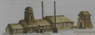
Старый завод, Первый завод

А как же старая машина – утюг – божество и охраняет Кубаску? Завалы того времени работали на дровах. Заводы леса истощались. Вокруг Гурьевского и Гавриловского заводов лес истощался, но дровяной пилатье было очень все дальше и дальше. И вот тогда стали обращать внимание на привоз Англии, где в промышленности использовались утюги. Тем более что и металл заводился именно от пилатель. Инженеры стали проводить на заводах опыты по плавке металла с помощью комбината утюга. Утюги привозили из Англии (месторождения в Вельской район). Здесь и появились первые утюжные заводы. А в 1983 году в Бельчугино (ныне город Ленинск-Кузнецкий) приступил к строй первый завод «Утюжка».