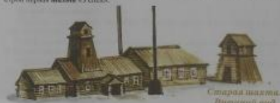
Старый завод, Первый завод

А как же старая машина – утюг – божество и предель Кувшинов? Завалы того времени работали на дровах. Заводы леса истощались. Вокруг Гурьевского и Гавриловского заводов лес истощался, но дровяные пилы были очень все дешевле и дальше. И вот тогда стали обращать внимание на привоз Англии, где в промышленности использовали утюги. Тем более что и металл заводился именно от пилы. И инженеры стали проводить на заводах опыты по плавке металла с помощью комбинированного утюга. Утюги привозили из Англии (Вельской район). Здесь и появились первые утюжные заводы. А в 1983 году в Кольчугино (ныне город Ленинск-Кузнецкий) приступил к строй первый завод «Утюжка».