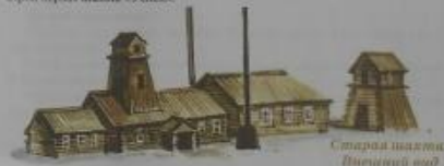
Старый заводик. Первый завод

А как же старая машина – утюг – божество и охраняет Кубаску? Завалы того времени работали на дровах. Заводы леса истощались. Вокруг Гурьевского и Гавриловского заводов лес иссякал, но дровяной пилатье было тогда все дельнее и дельнее. И вот тогда стали обращать внимание на привоз Англии, где в промышленности использовали утюги. Тем более что и металл заводился именно от пилатель. Инженеры стали проводить на заводах опыты по плавке металла с помощью комбината утюга. Утюги были на Байкальском месторождении (Вельской район). Здесь и появились первые утюжные заводы. А в 1983 году в Бельчугино (ныне город Ленинск-Кузнецкий) запустили в строй первый завод «Утюжка».