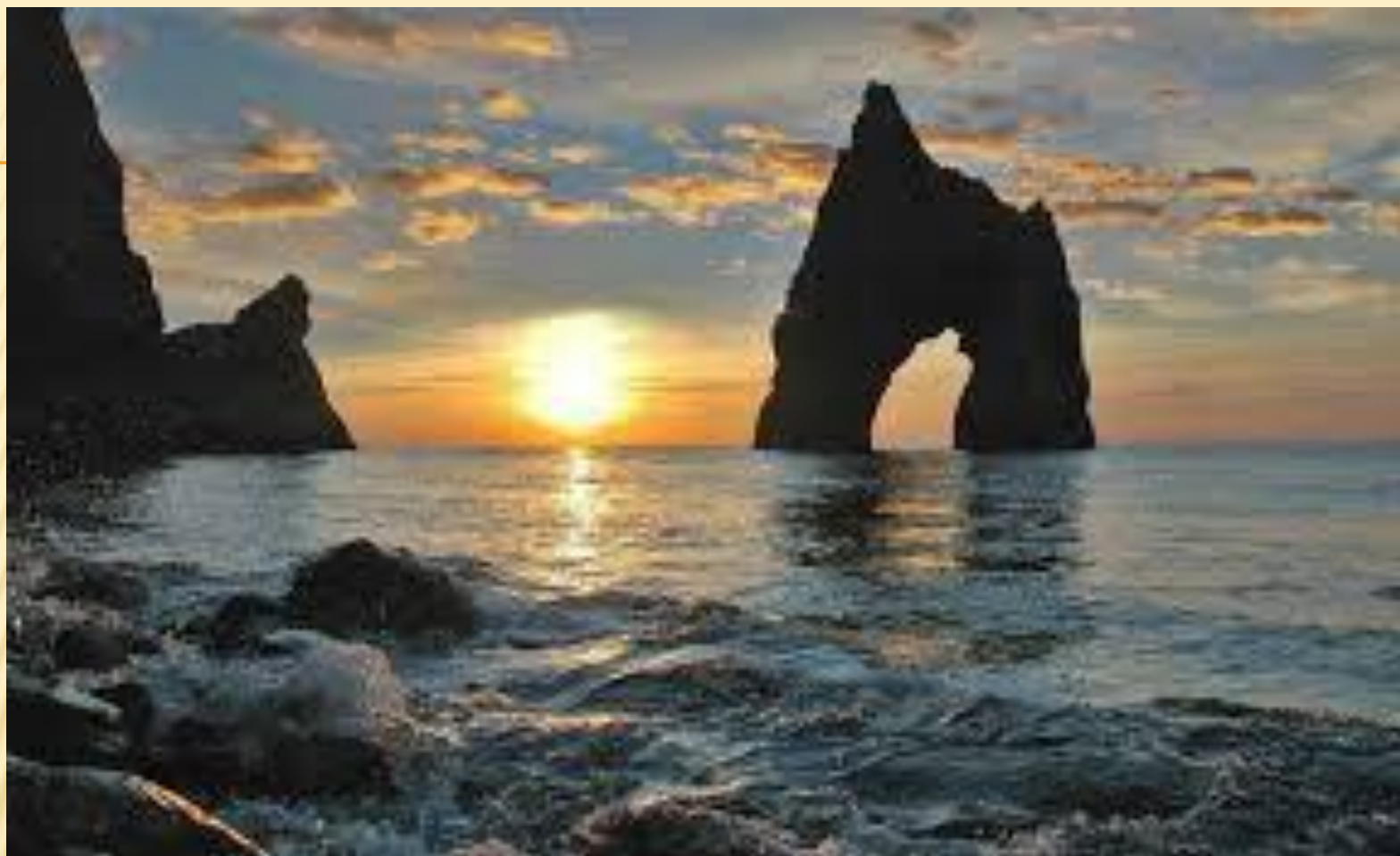
Золотые ворота Карадага