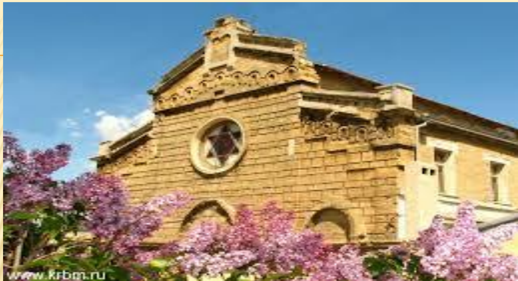
Синагога Егие -Капай