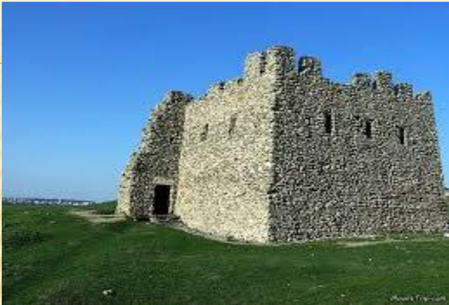
Неаполь - Скифский