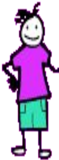
Волонтеры пропагандируют здоровый образ жизни!