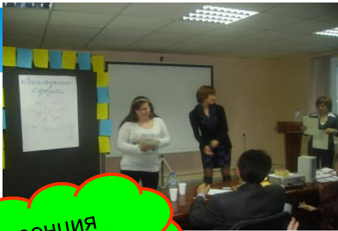
Конференция «Наркотикам – нет!»