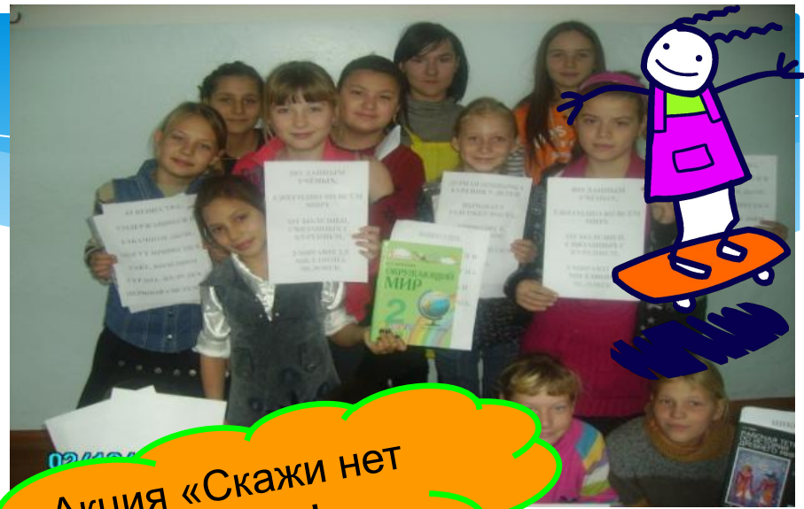
Акция «Скажи нет – курению!»