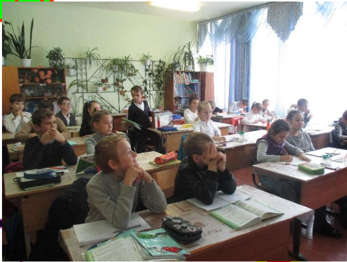
Волонтеры пропагандируют здоровый образ жизни!