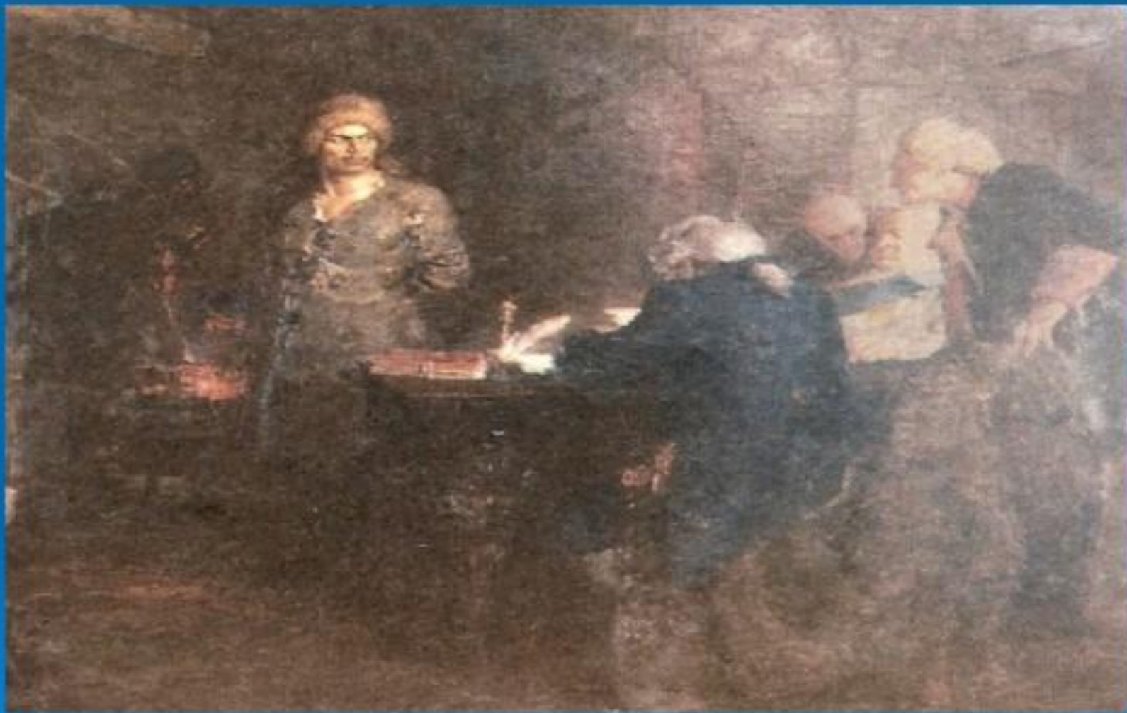
«Допрос Салавата Юлаева» художник А.Кузнецов