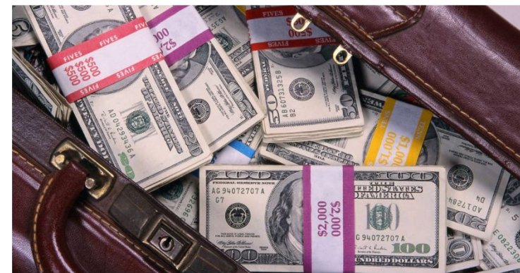
Изымание денег в 10 раз больше, чем сама взятка