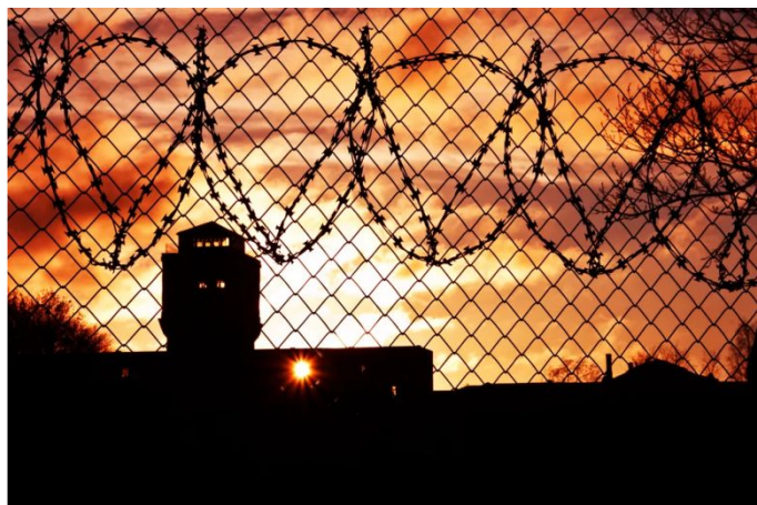
Тюрьма строго режима