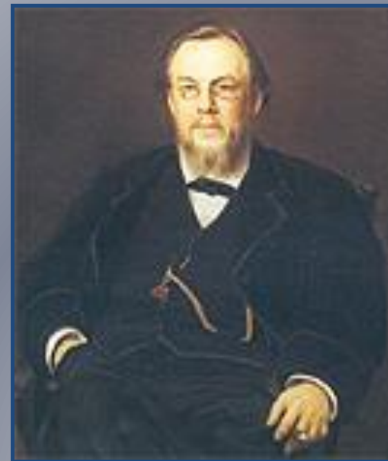
С. П. Боткин.