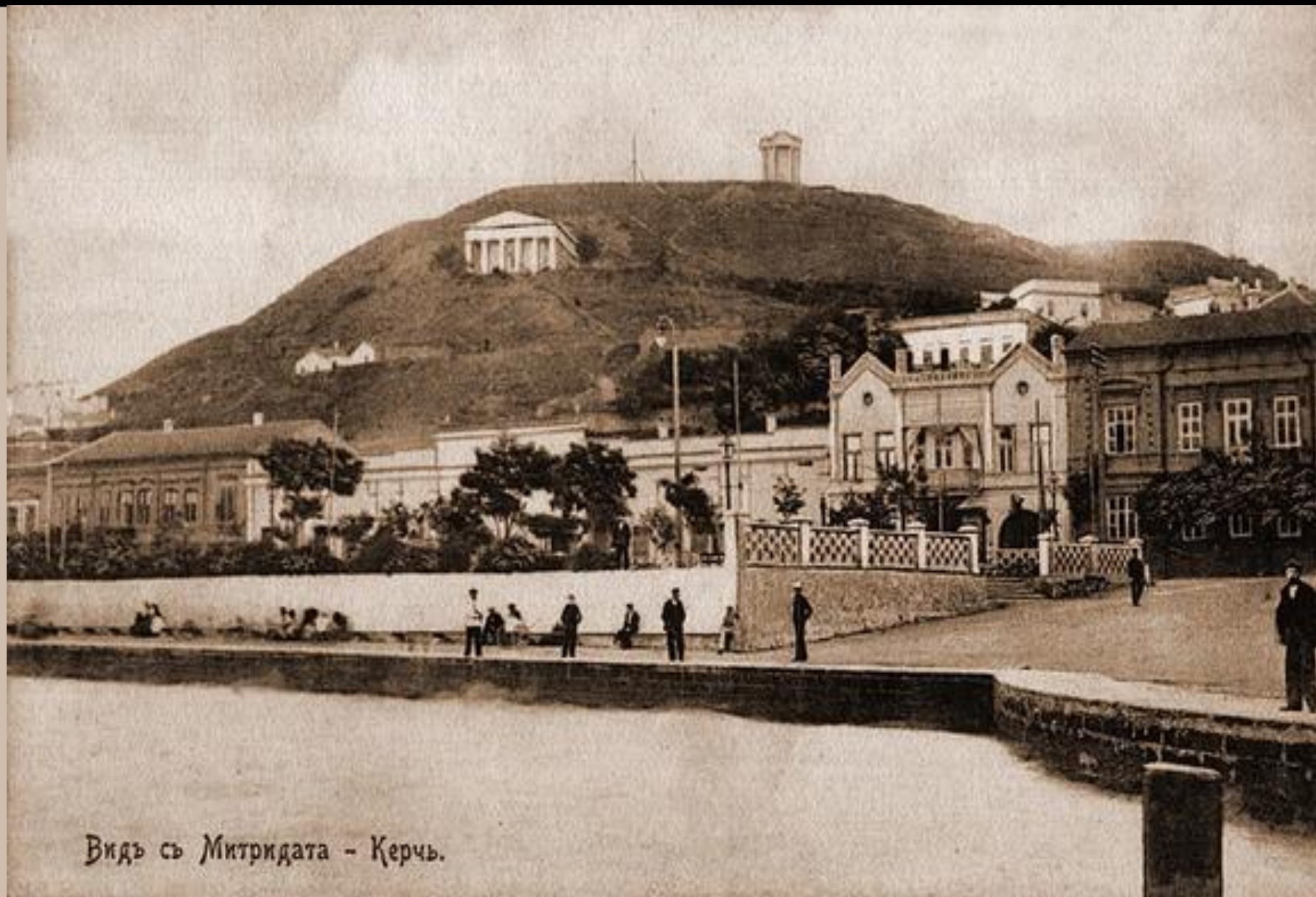
Видъ съ Митридата - Керчь.