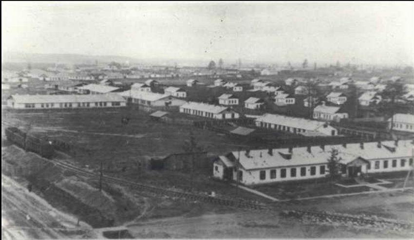
Квартал 40. Площадка строительства ~ техникума и дома №8. ~