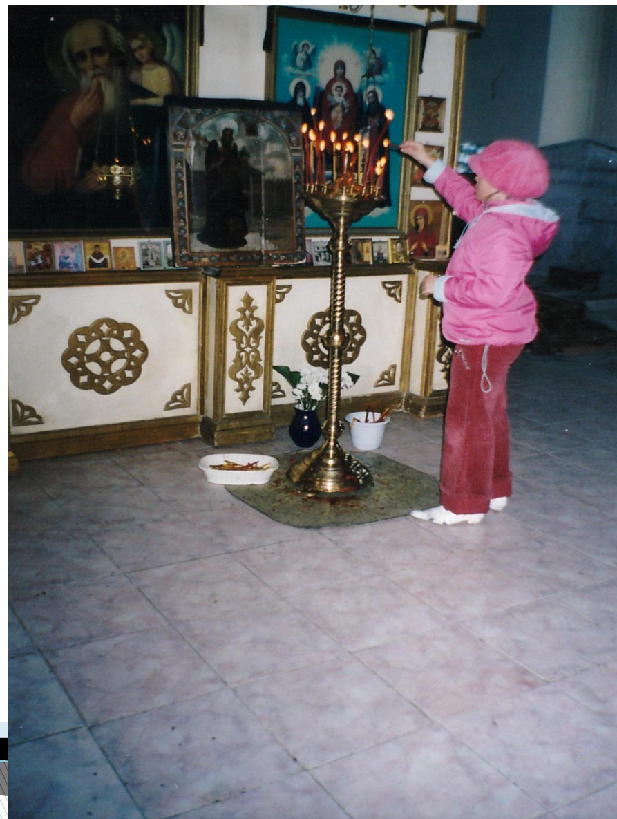
Внутреннее убранство храма