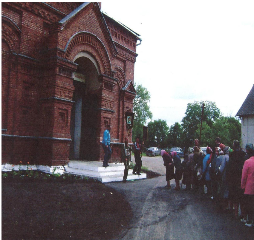
Церковь «Покрова Божией Матери» с. Гавриловское