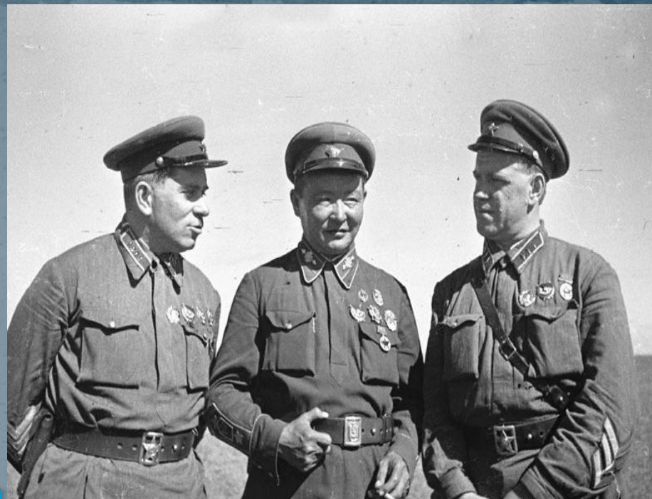
Казаки улуса Додо-Ичегуй Омичинское района 1915