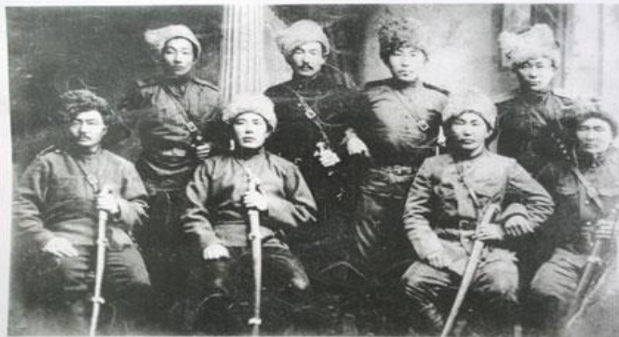
Казаки улуса Додо-Ичегуй (Нижний Ичегуй) фото предположительно 1914 года.