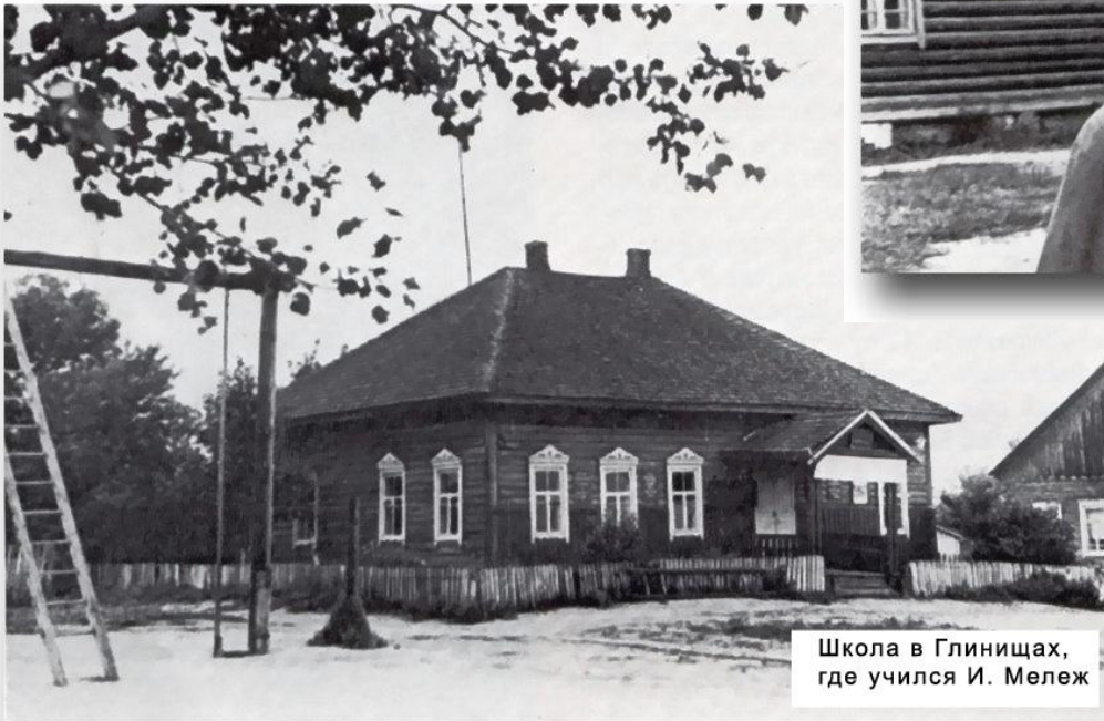
Школа в Глинищах, где учился И. Мележ

любіць зямлю, служыць ей усімі сіламі сваёй душы і сэрца.