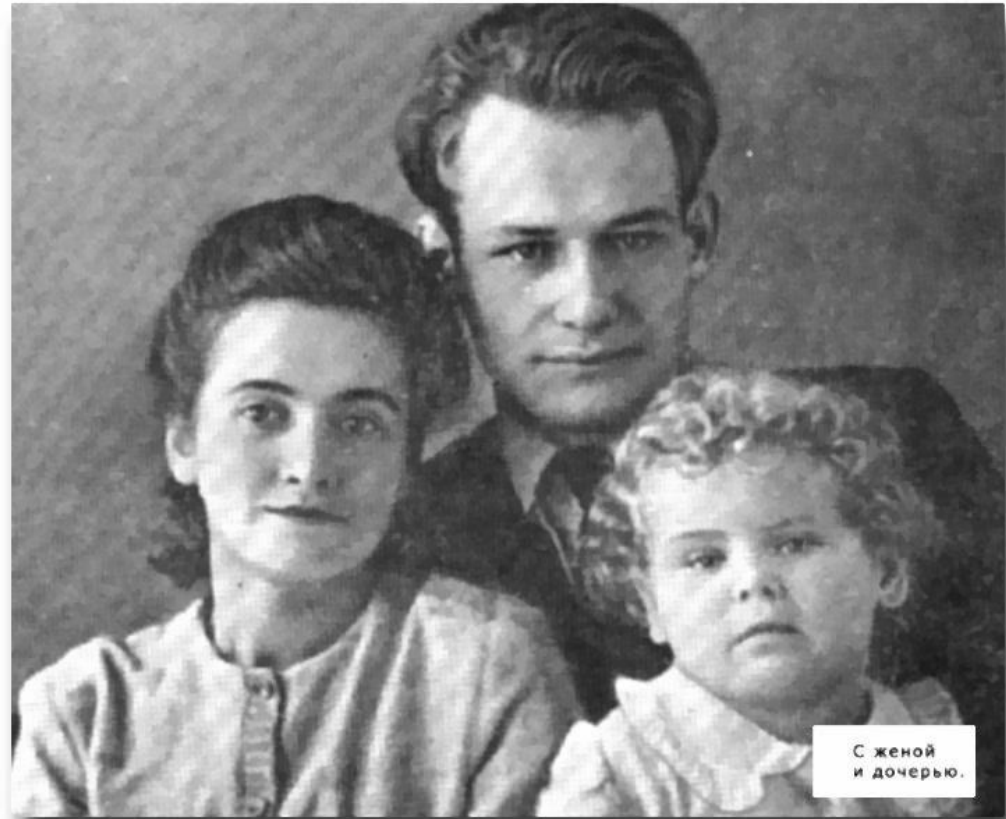
С женой и дочерью.