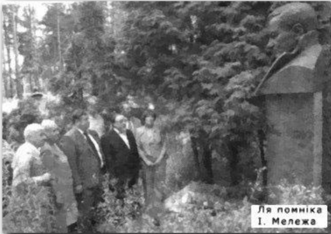
Ля помніка І. Мележа