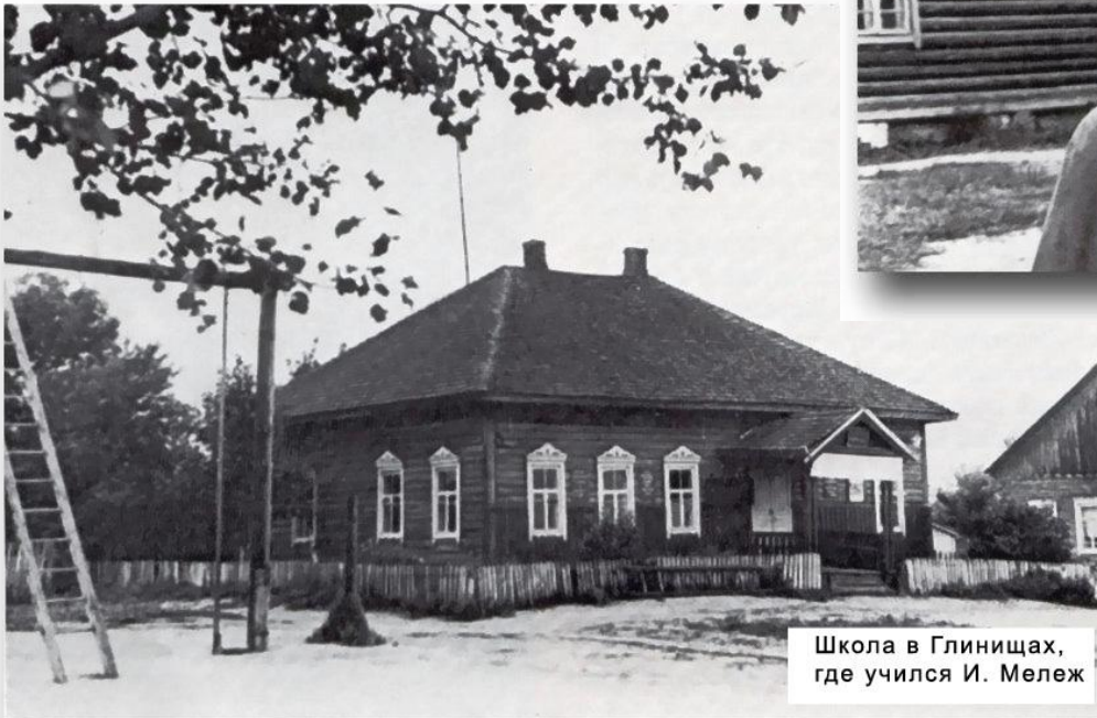
Школа в Глинищах, где учился И. Мележ

любіць зямлю, служыць ей усімі сіламі сваёй душы і сэрца.