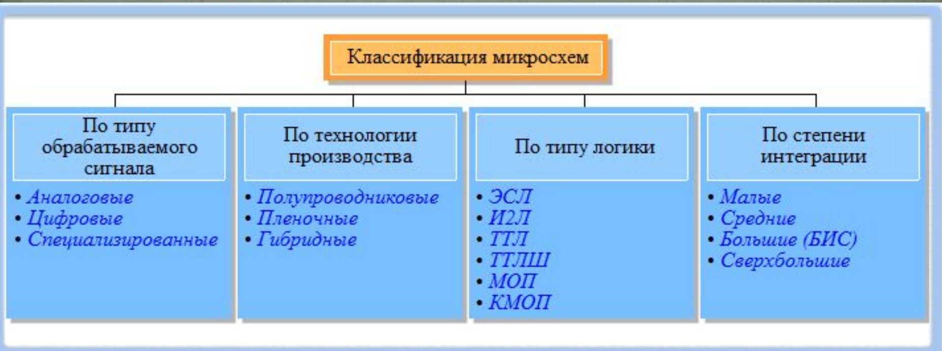
Модель 1. Классификация микросхем