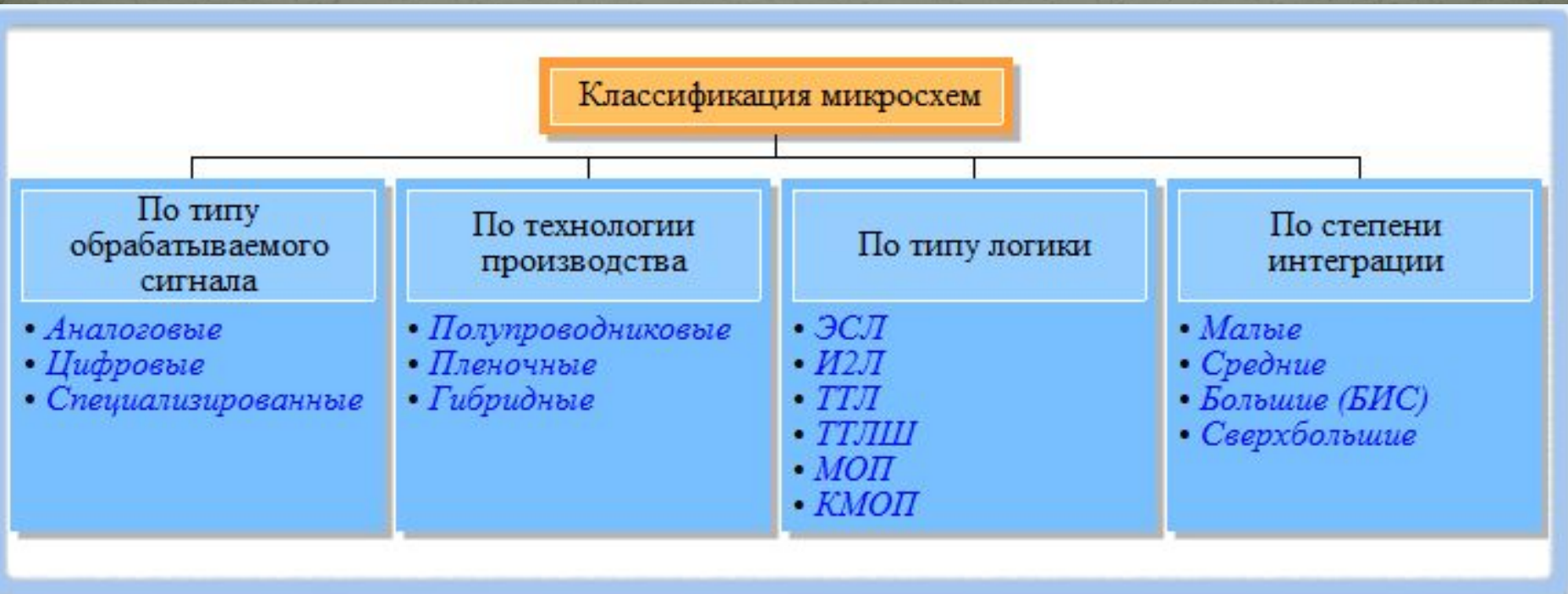
Модель 1. Классификация микросхем