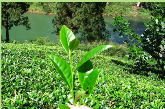
Верхушка чайного куста флеш.