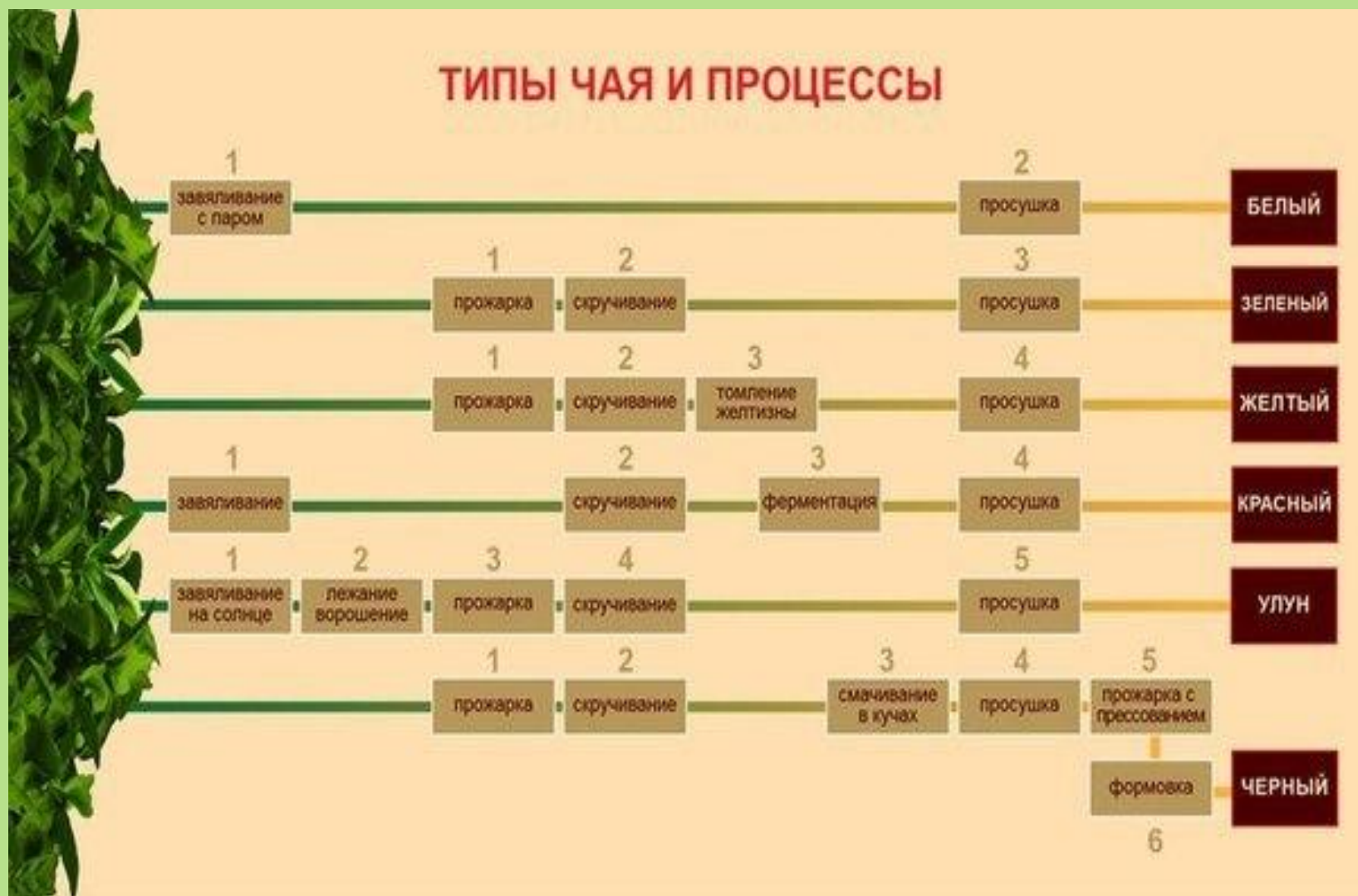
Этапы производства различных видов чая.