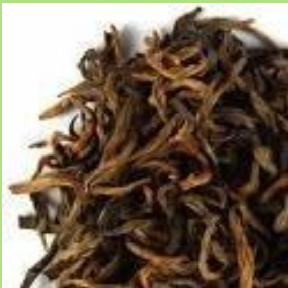
Чай мешаный, неоднородный