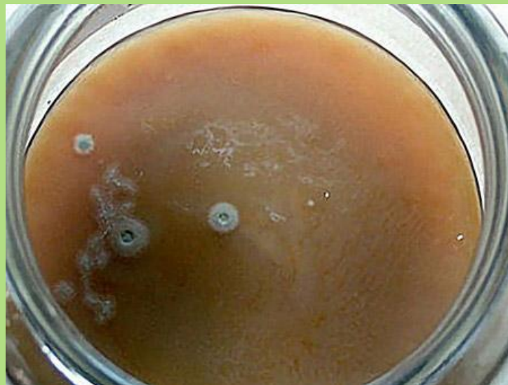
Болезнь чайного гриба.