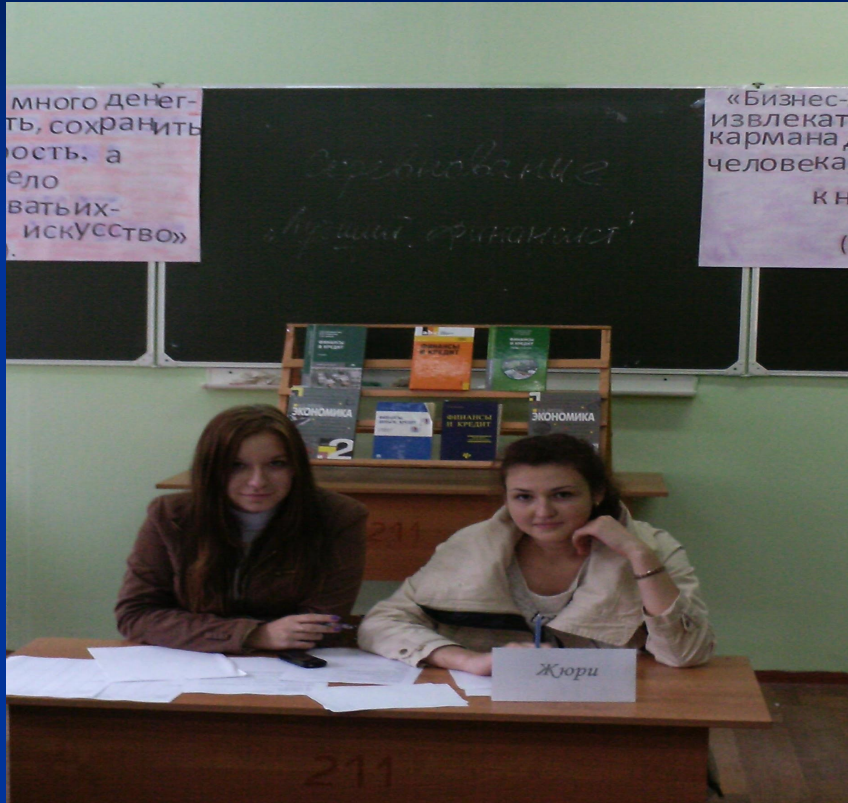
Фото жюри и приглашенных ЛИЦ