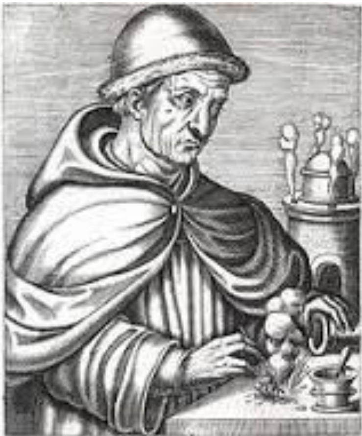
Бертольд Шварц XIV век