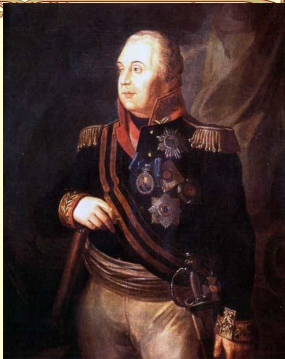
Михаил Илларионович Голенищев-Кутузов

Кутузов был участником многих войн, в которых проявил себя не только выдающимся военачальником, но и исключительным храбрецом.