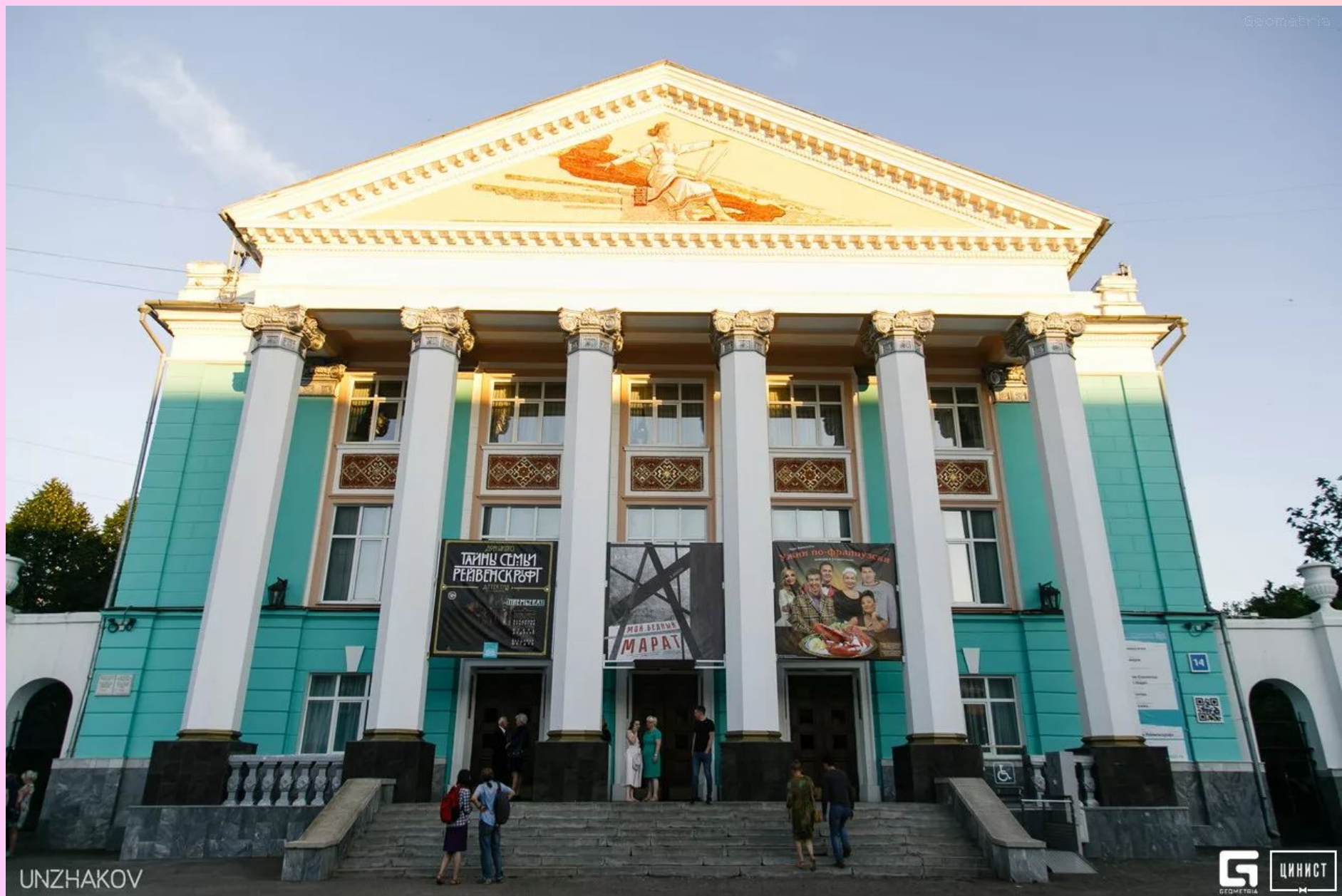
Русский Драматический театр.