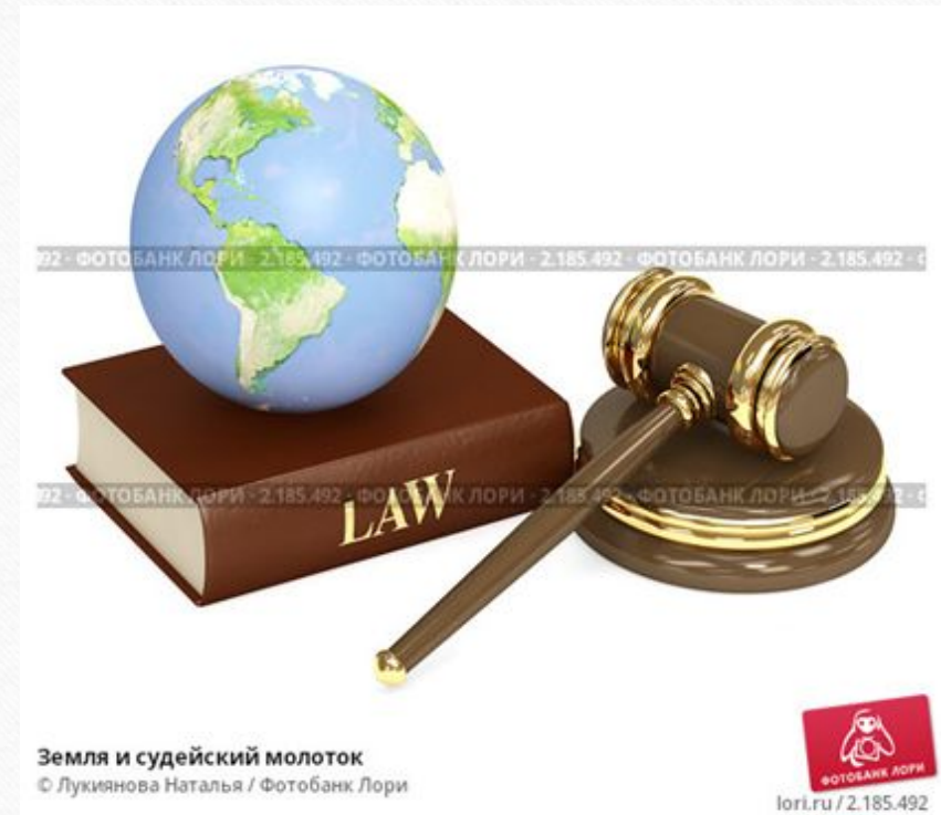
Земля и судейский молоток